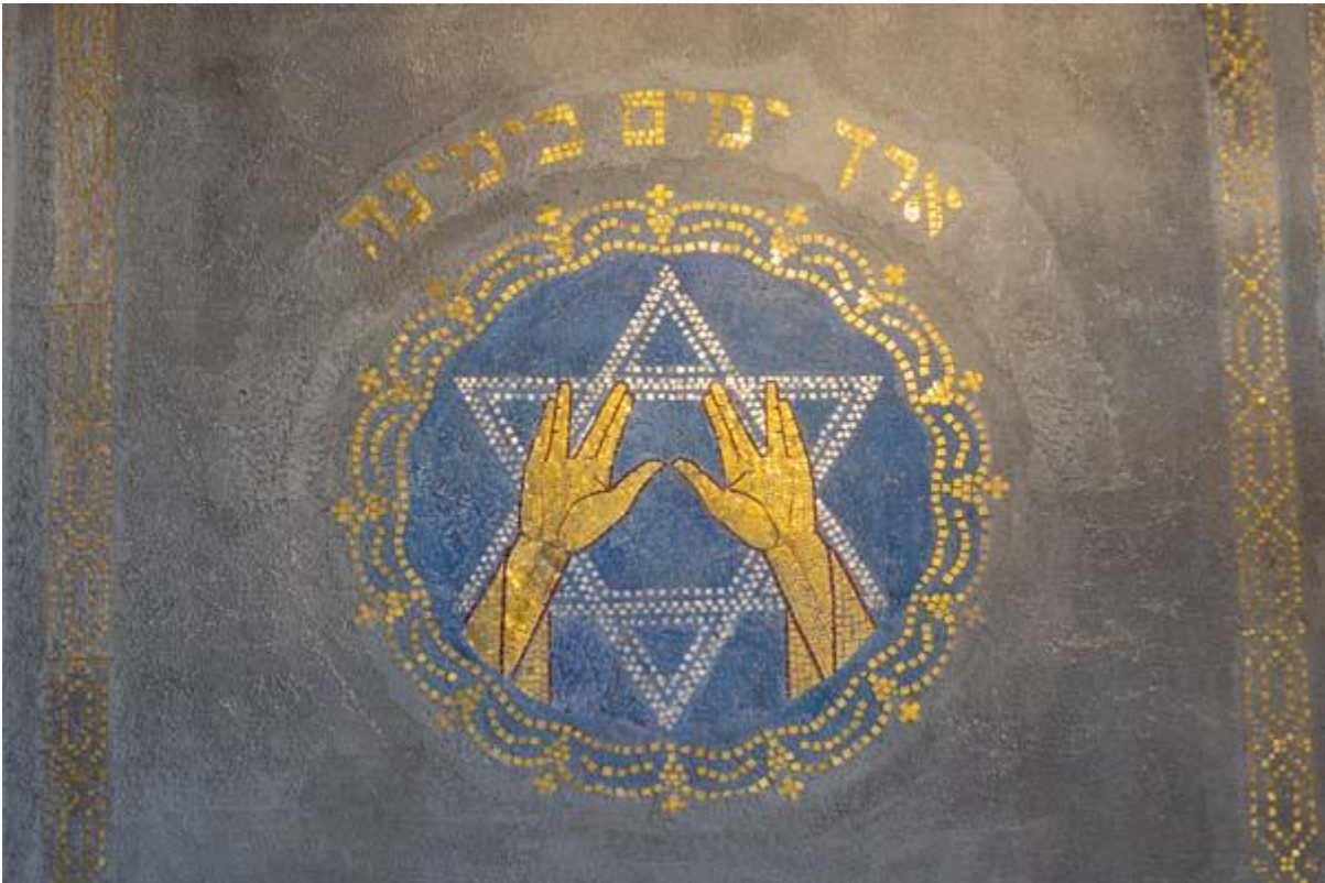
Synagoge detail wand handen