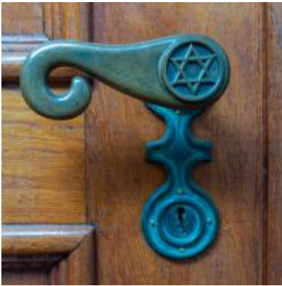
Synagoge detail deurkruk

Verlichting, vloeren, plafonds, meubels, ramen enz., veel ervan is ontworpen door de architect. Zelfs details in hekwerk en deurklinken zijn speciaal voor deze synagoge ontworpen.