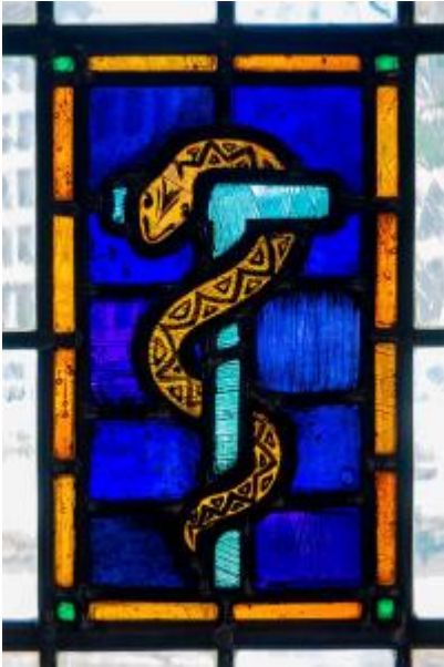
Synagoge glas-in-lood detail slang