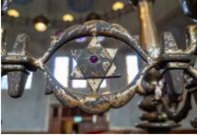
Synagoge detail davidster

Er is heel veel te zien en onze gids kan prachtig vertellen over de synagoge. Na de tour met de gids kun je nog rustig op ontdekkingstocht. Als je eindelijk klaar bent, krijg je koffie met eigengemaakte appeltaart.