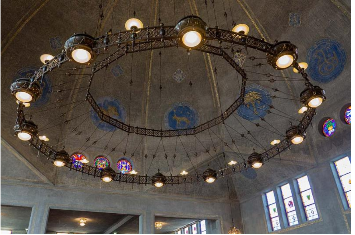
Synagoge plafond koepel met lampen