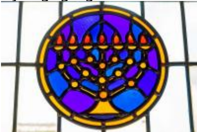
Synagoge glas-in-lood detail menorah Afbeelding