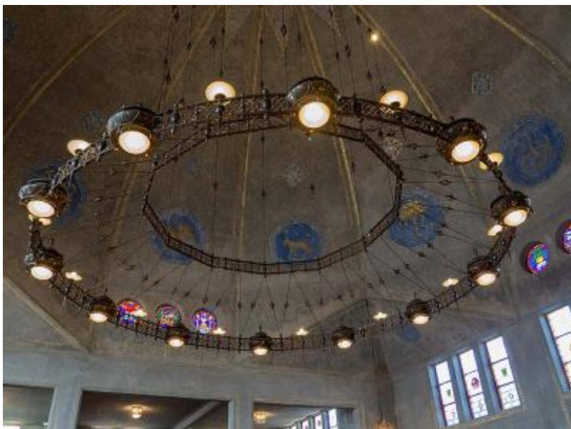
Synagoge plafond koepel met lampen