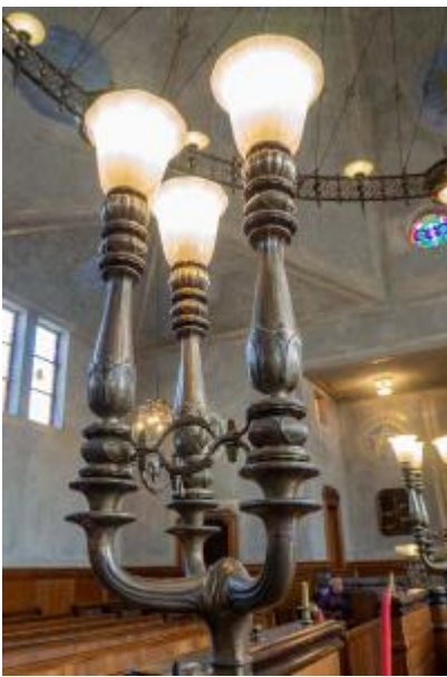
Synagoge detail lamp

Er hangt een enorme lamp, een cirkel met 12 lampen. Ik ben vergeten wat het gevaarte weegt. Heel indrukwekkend en prachtig ontworpen en gemaakt. De halve bollenaan de onderkant van de lampen vind je overal in het gebouw terug.