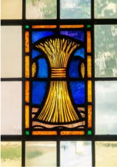
Synagoge glas-in-lood detail korenschoof