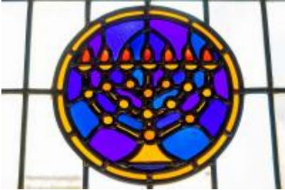
Synagoge glas-in-lood detail menorah Afbeelding