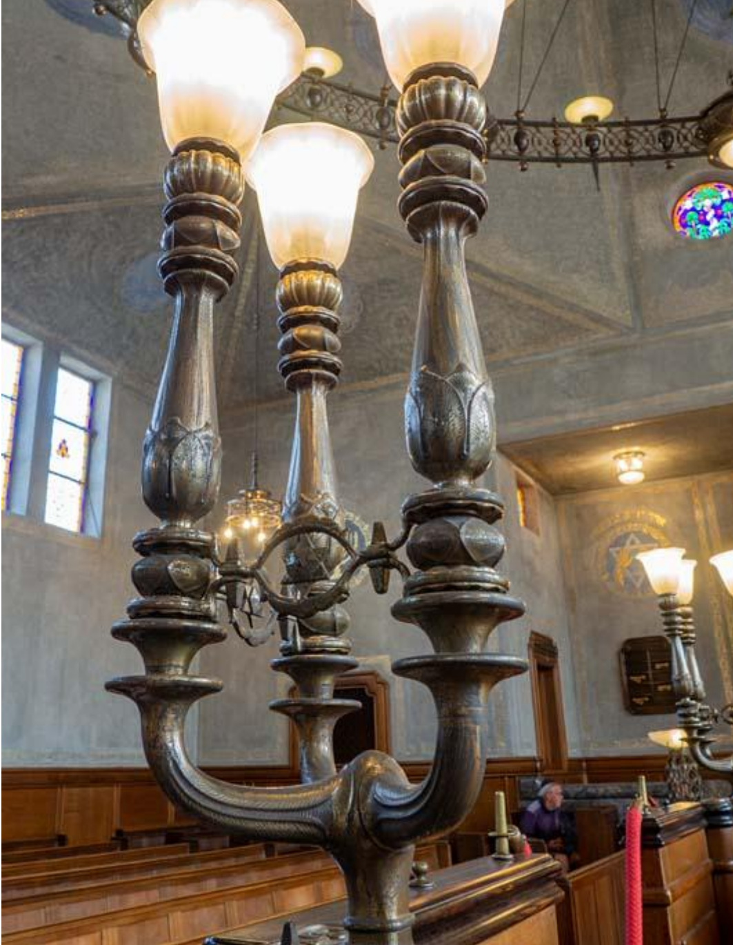
Synagoge detail lamp