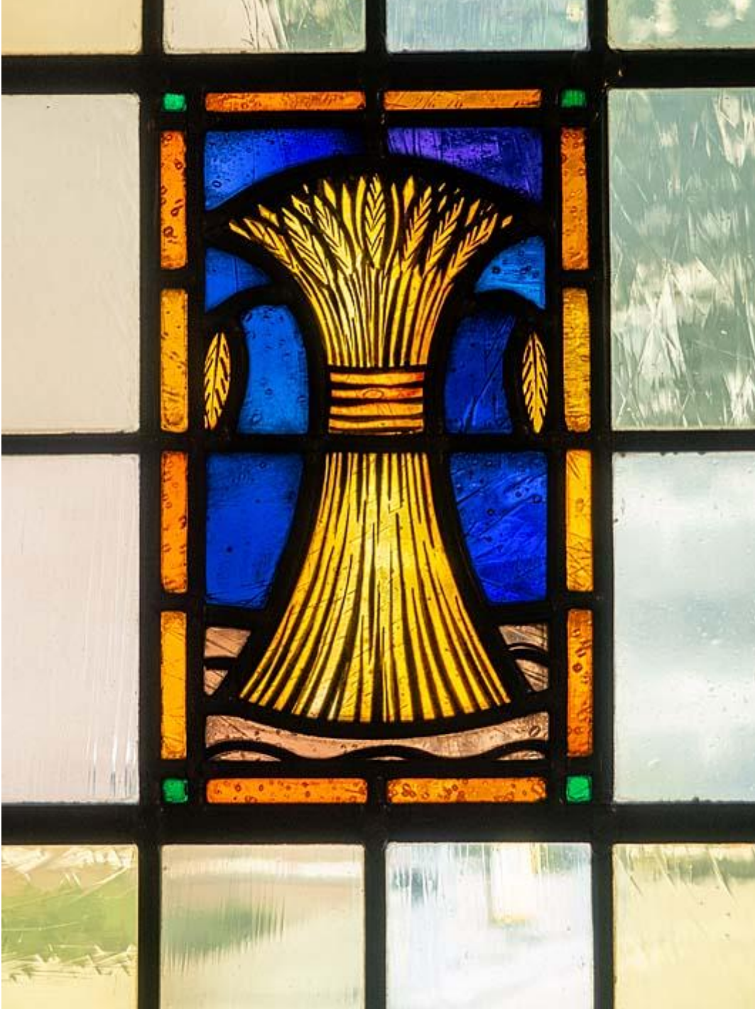
Synagoge glas-in-lood detail korenschoof