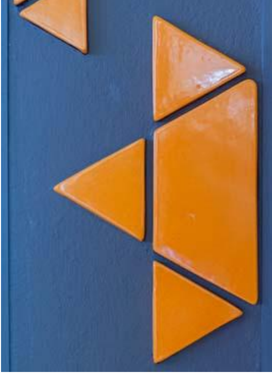
Synagoge versiering wand