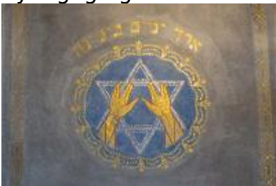
Synagoge detail wand handen

De functies van de vertrekken kwamen aan bod en het werk van De Bazel aan de synagoge. In de verschillende ruimtes zie je Joodse symbolen o.a. in de gebrandschilderde ramen. Hier zie je er een paar.