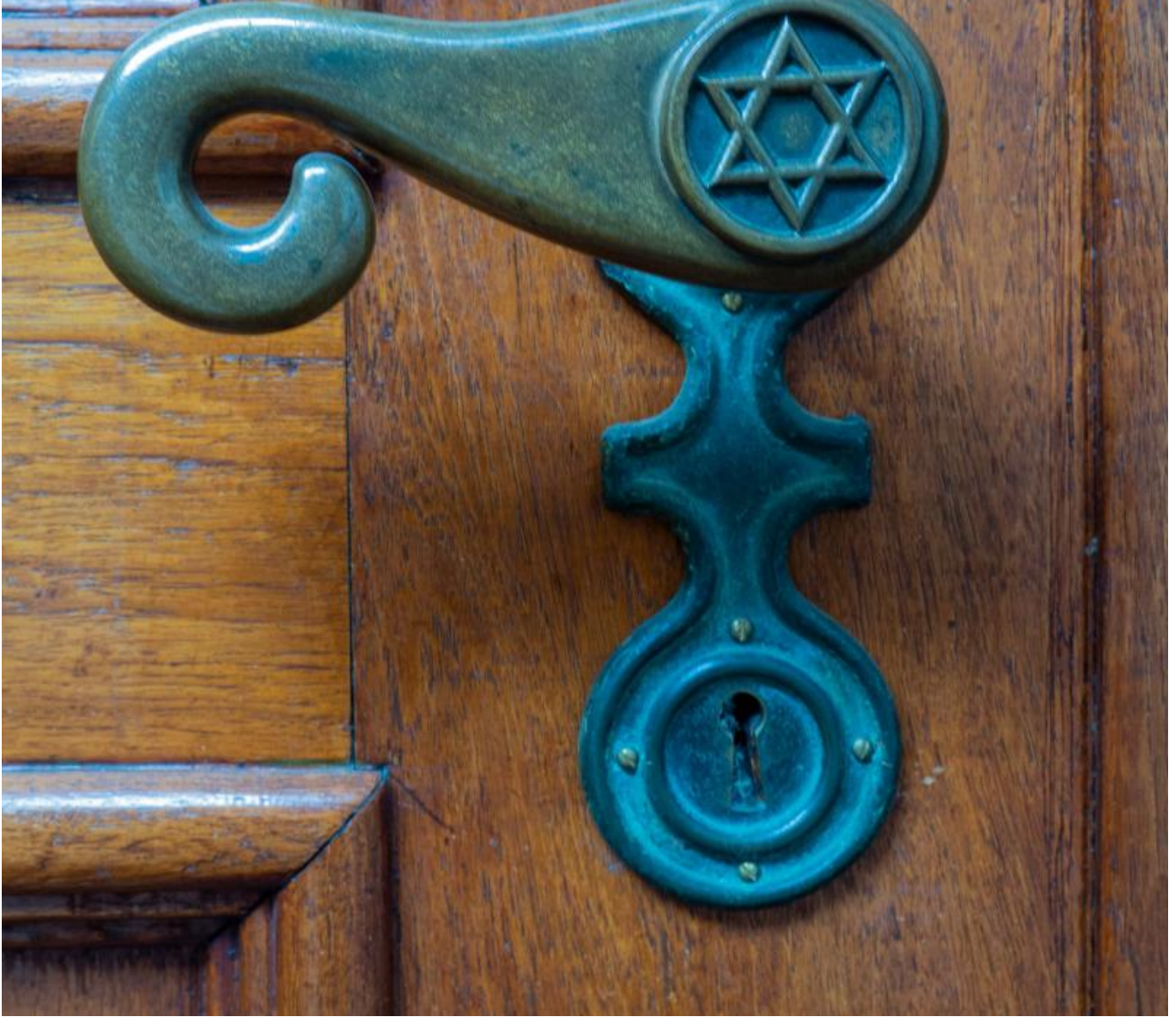
Synagoge detail deurkruk