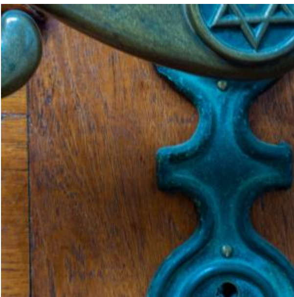
Synagoge detail deurkruk