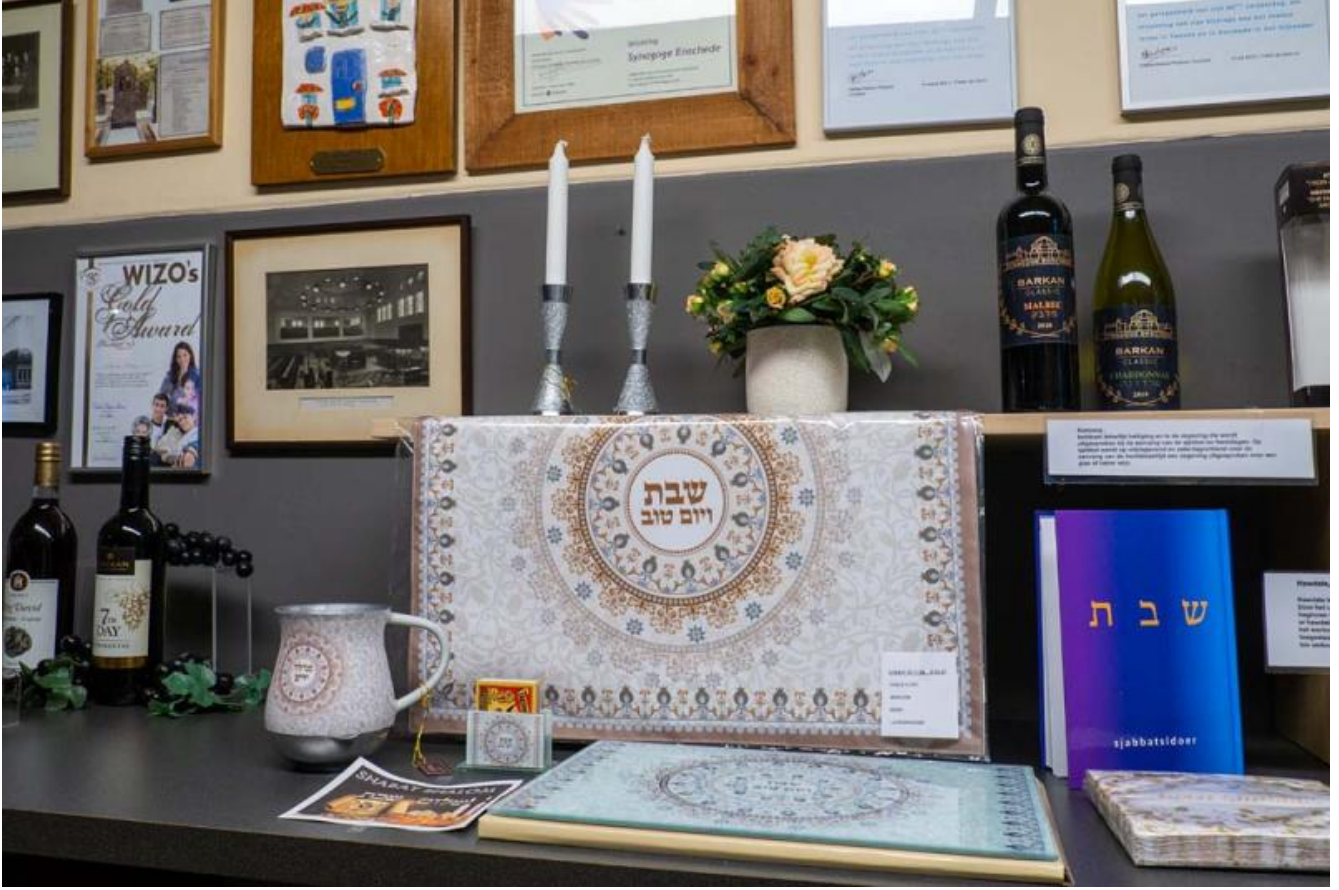
Synagoge in de hal