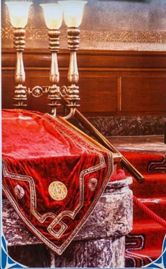
Synagoge banner welkom

Welkom in de mooiste synagoge van Nederland!