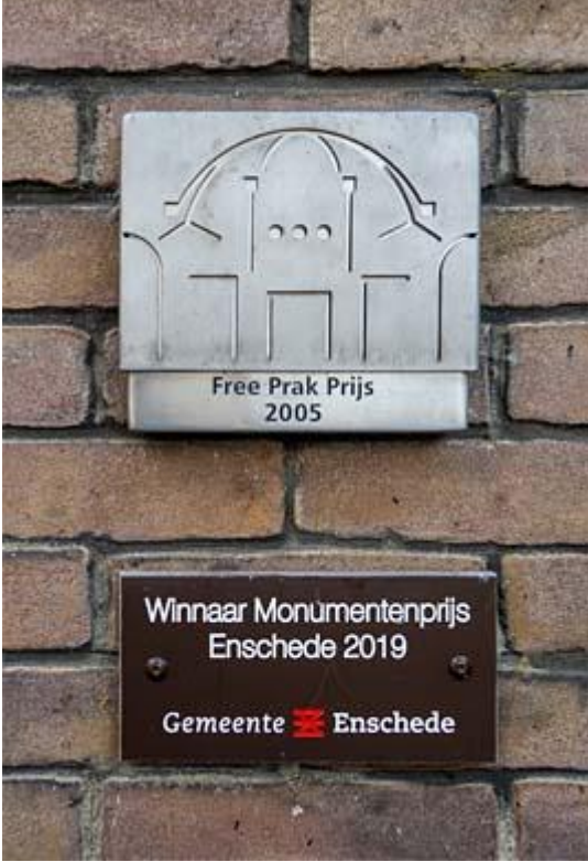
Synagoge bordje monument