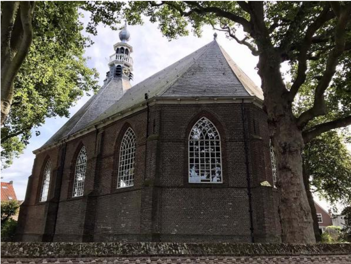
Kerk IJzendijke, Zeeuws-Vlaanderen Turkeye Afbeelding

Het is duidelijk een oud stadje met een historisch centrum en een historische kerk. Kijk maar even bij de links hieronder. De kerk, Mauritskerk, staat op de foto hiernaast.