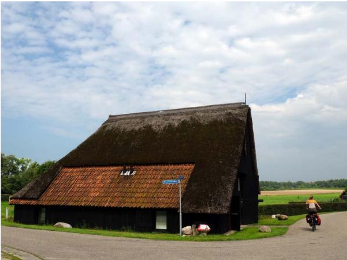
Borkeld, oude boerderij