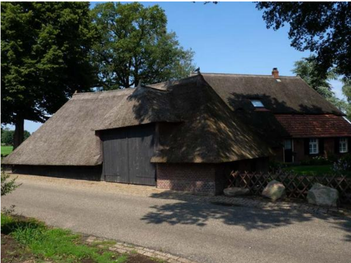
Borkeld, boerderij dwarsritschöppe