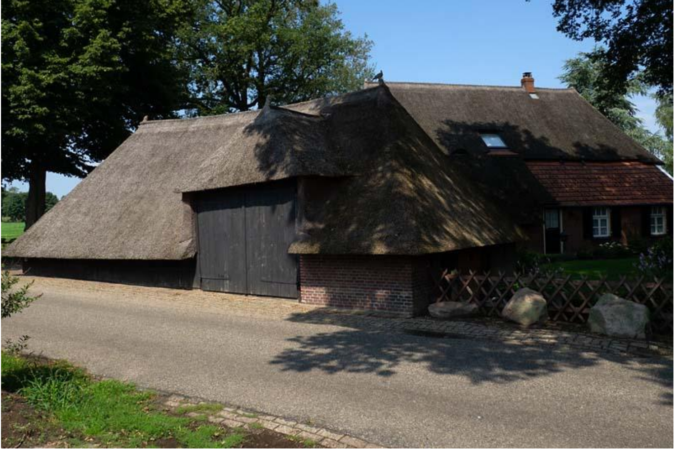
Borkeld, boerderij dwarsritschöppe