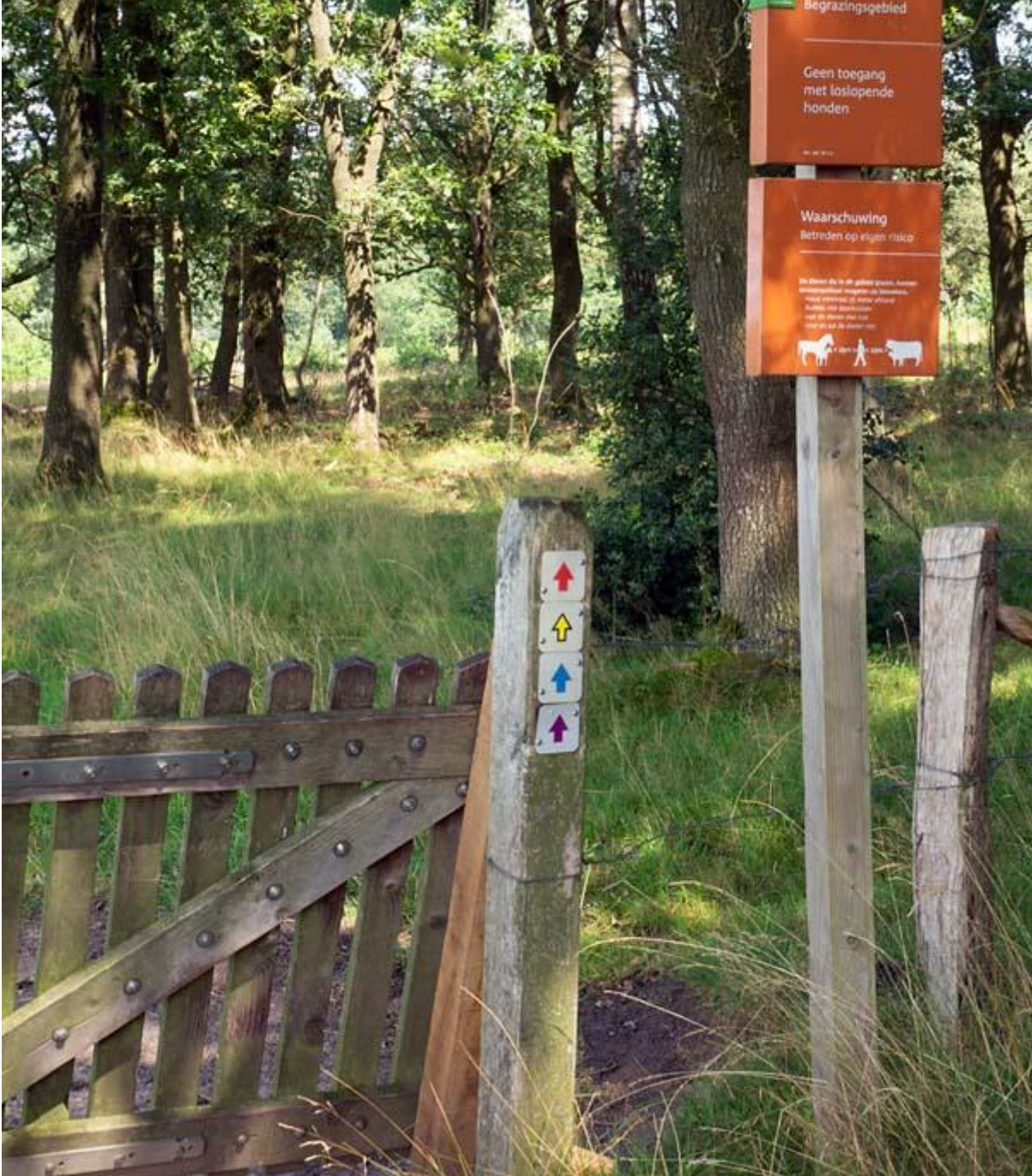
Borkeld ingang begraasd gebied