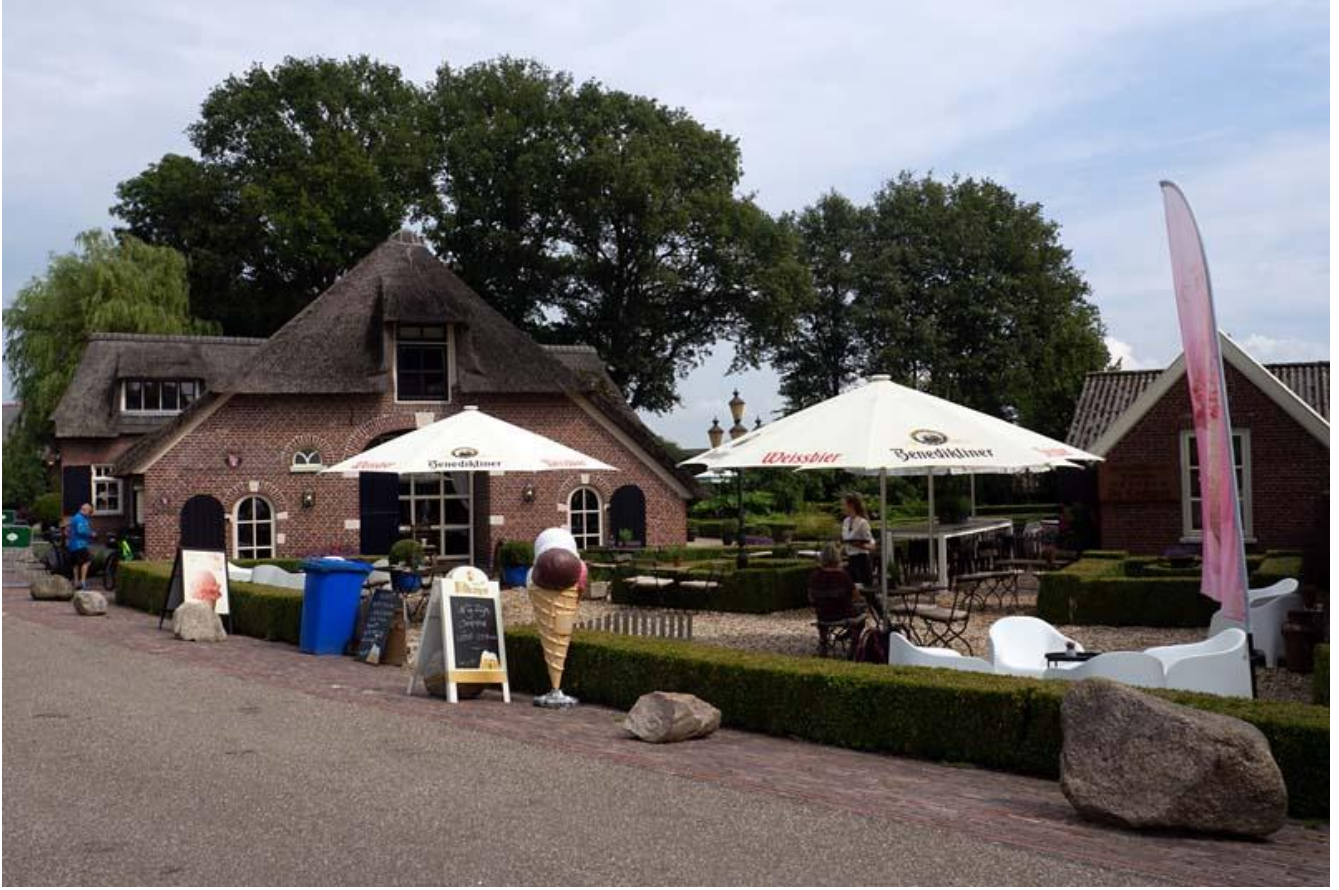
De Kemper voor koffie en lunch