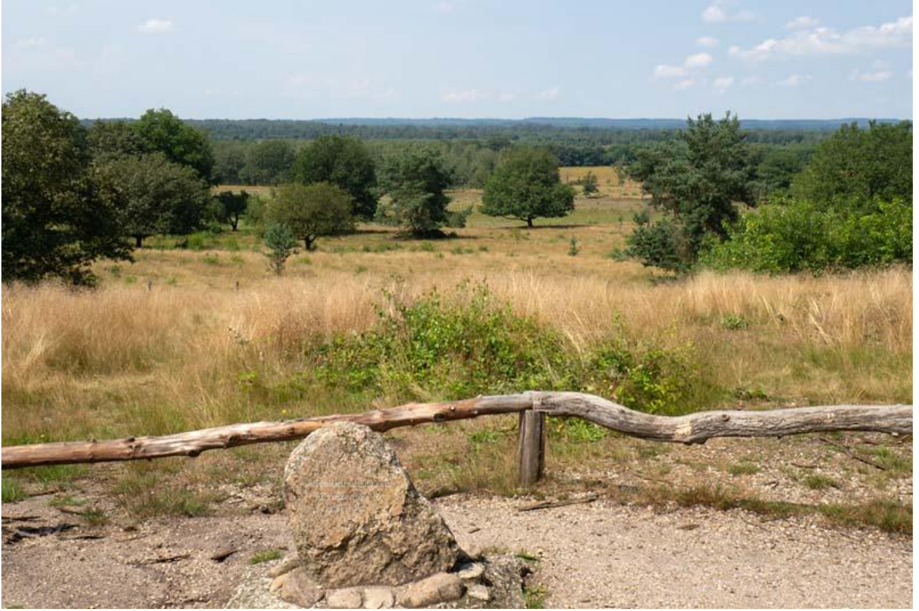
Borkeld, Friezenberg met uitzicht