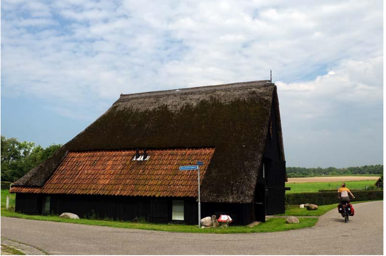
Borkeld, oude boerderij