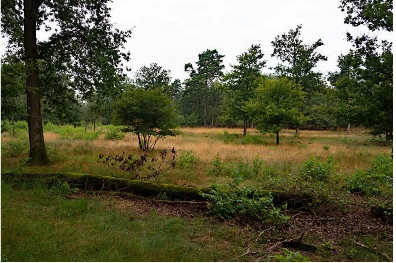
Borkeld, zicht op de heide 2