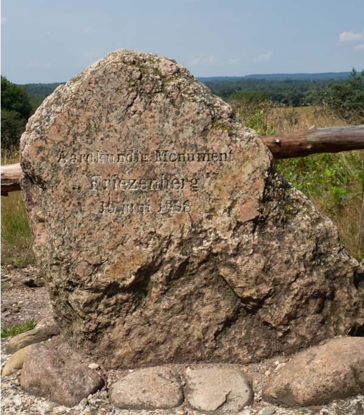
Friezenberg met steen, aardkundig monument