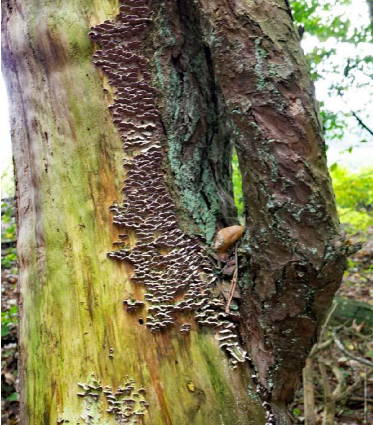
Boom met zwam