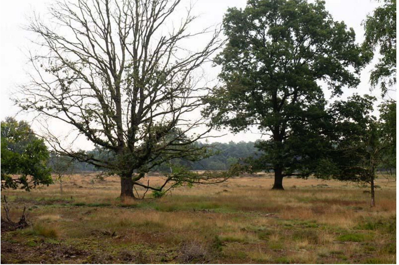
Borkeld, Hei en bos