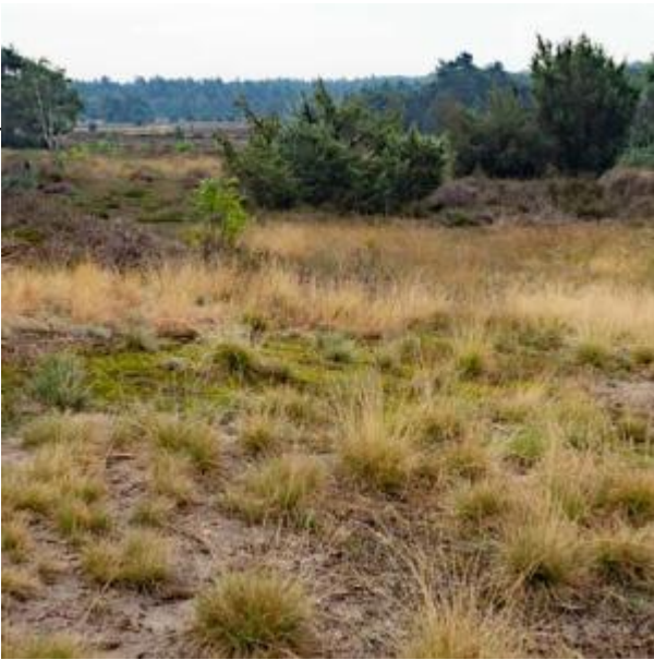
Borkeld hei met uitzicht