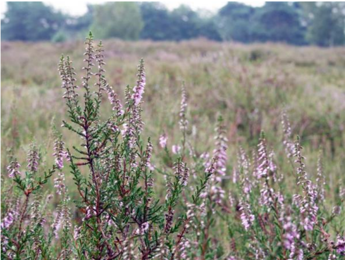
Borkeld, hei in bloei