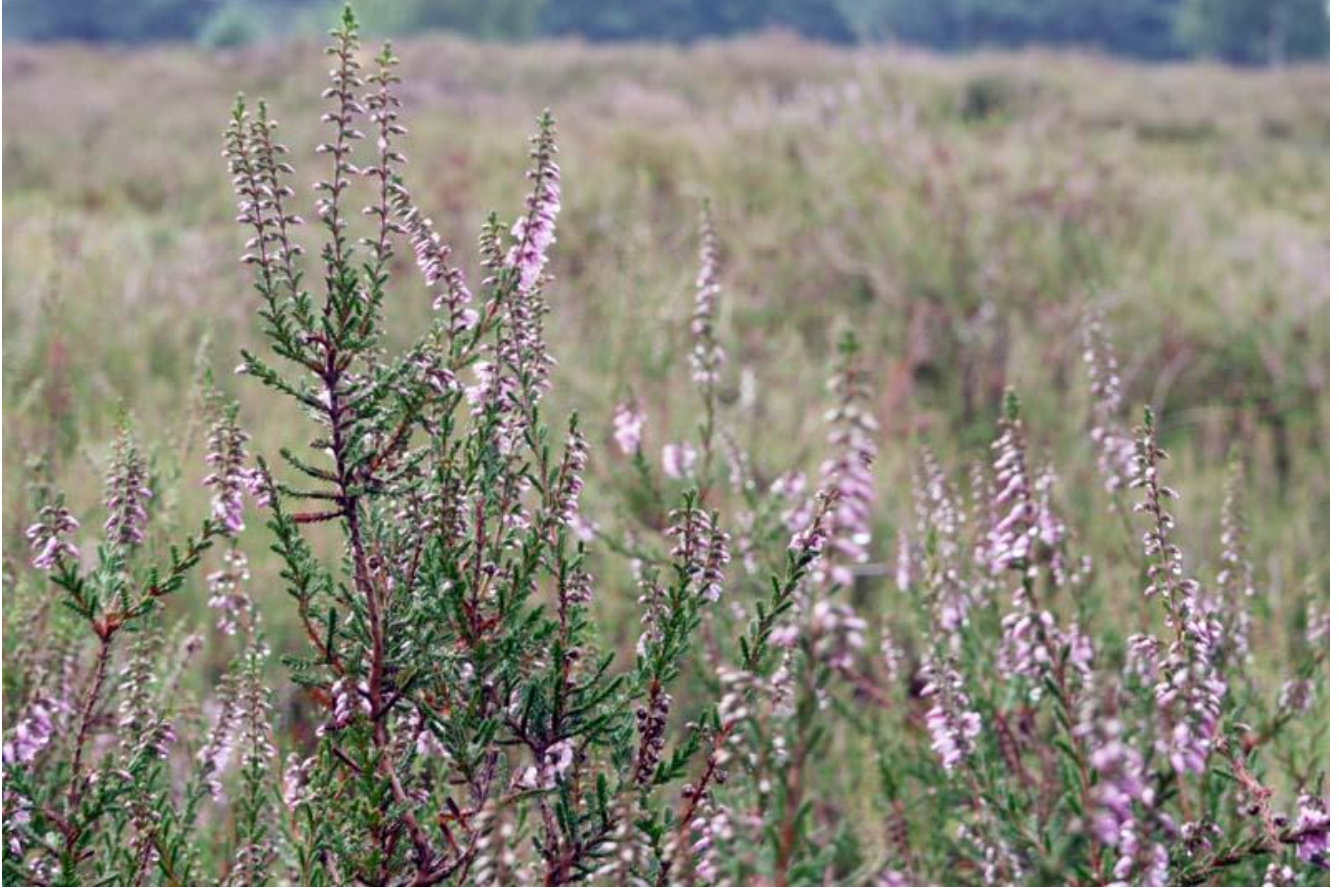
Borkeld, hei in bloei