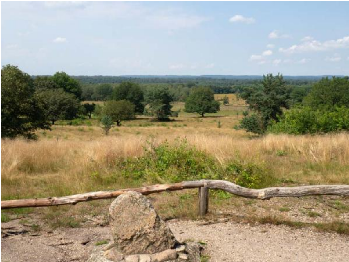
Borkeld, Friezenberg met uitzicht