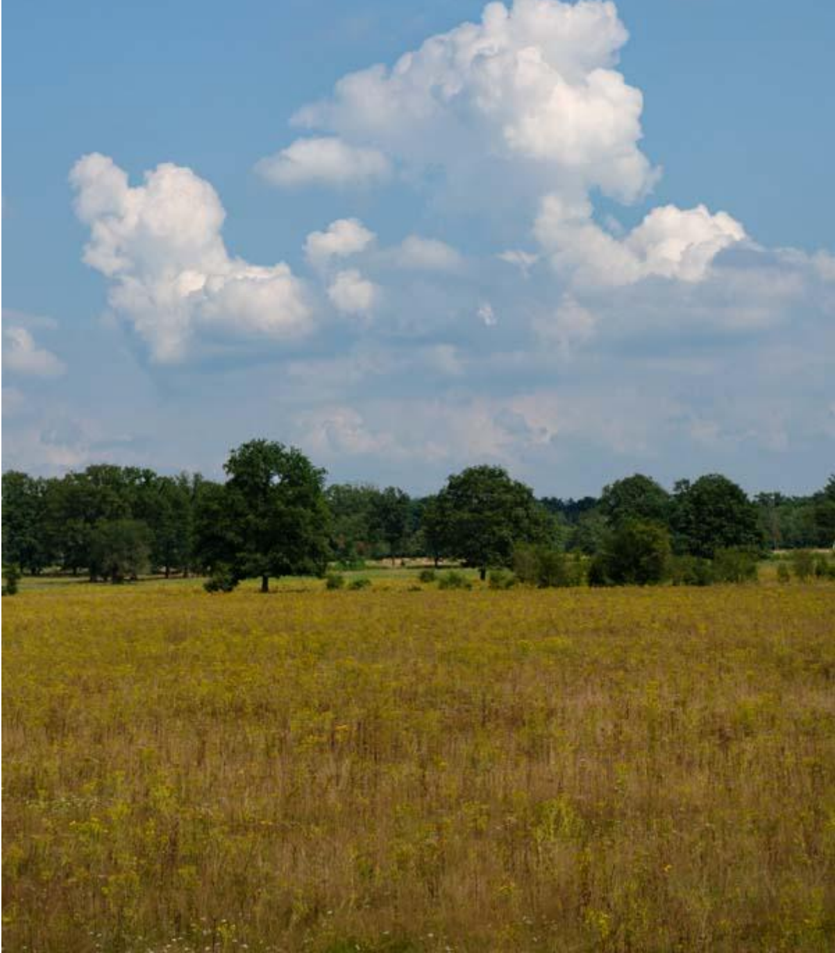
Elsenerveld- en veen