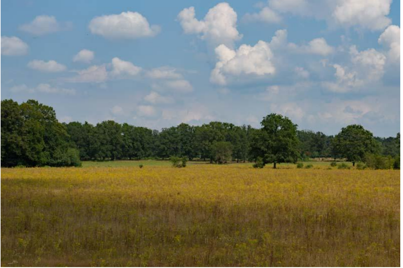
Elsenerveld- en veen 2