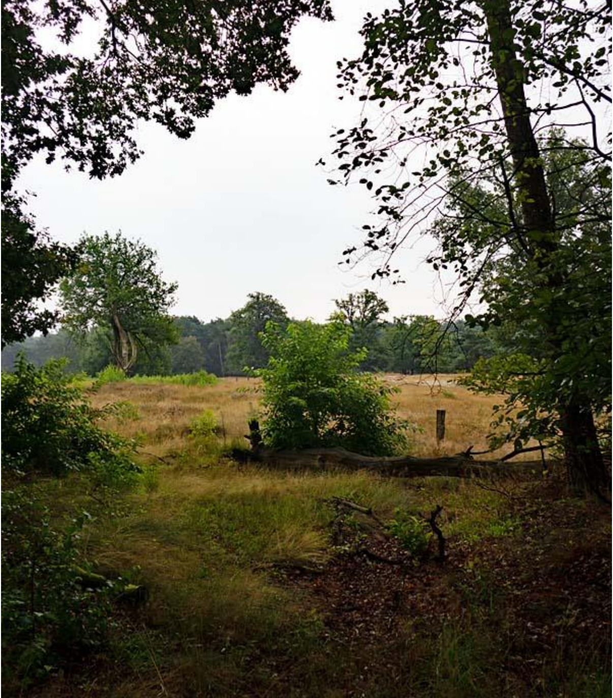
Borkeld, zicht op de heide