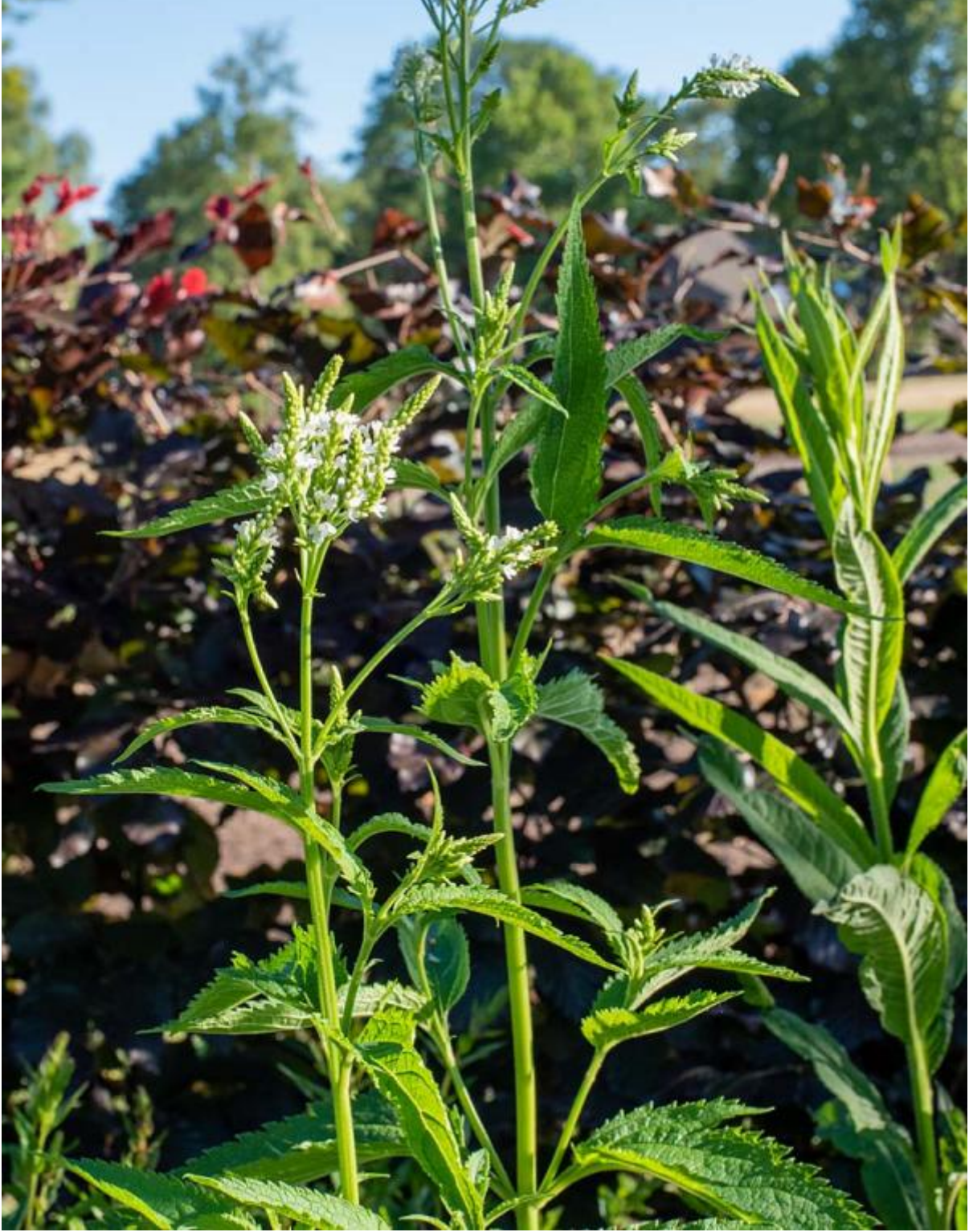
Verbena hastata white spires