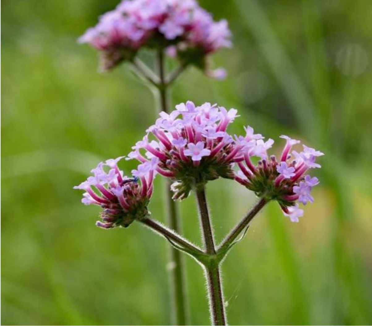
Verbena dichtbij verticaal