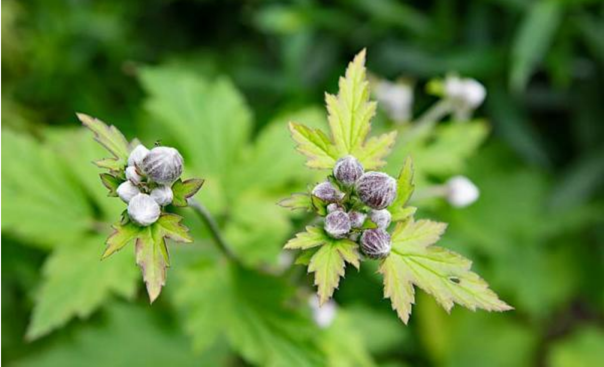
Herfstanemoon in de knop