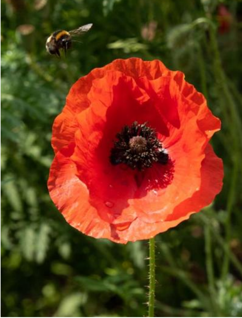
Klaproos aanvliegende bij