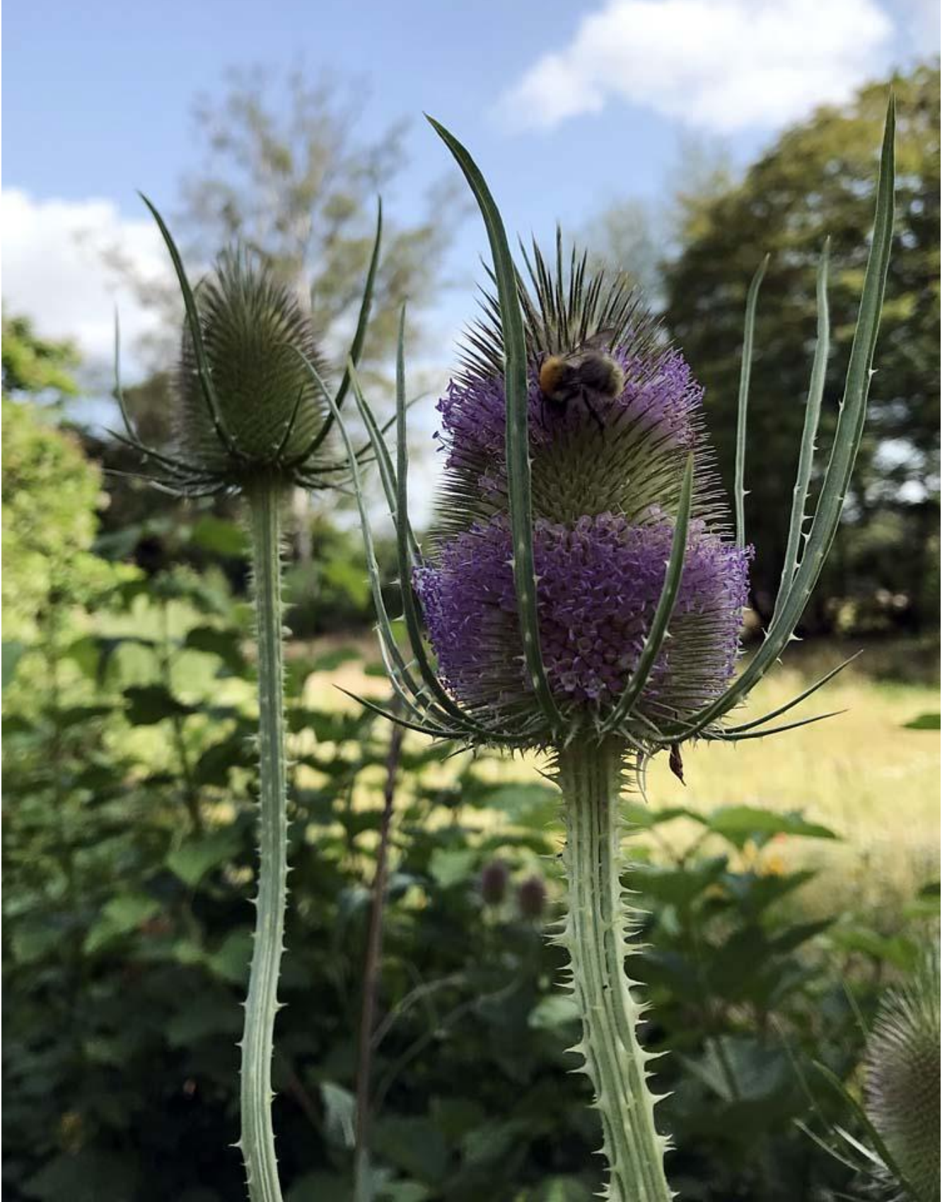
Dipsacus in bloei met bij