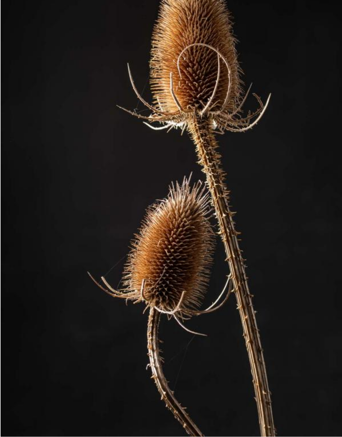
Dipsacus na de winter Afbeelding