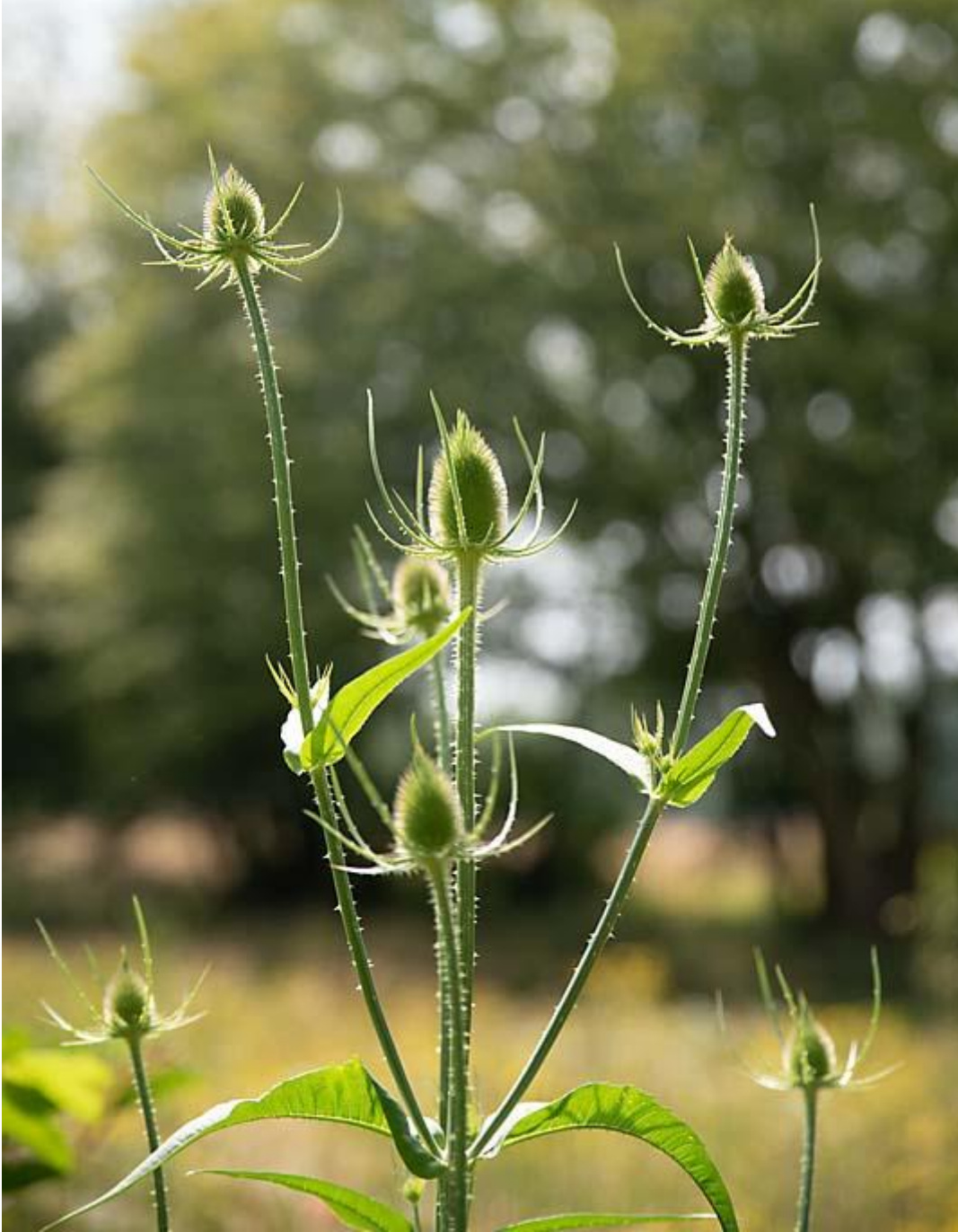
Dipsacus fullonum vroeg