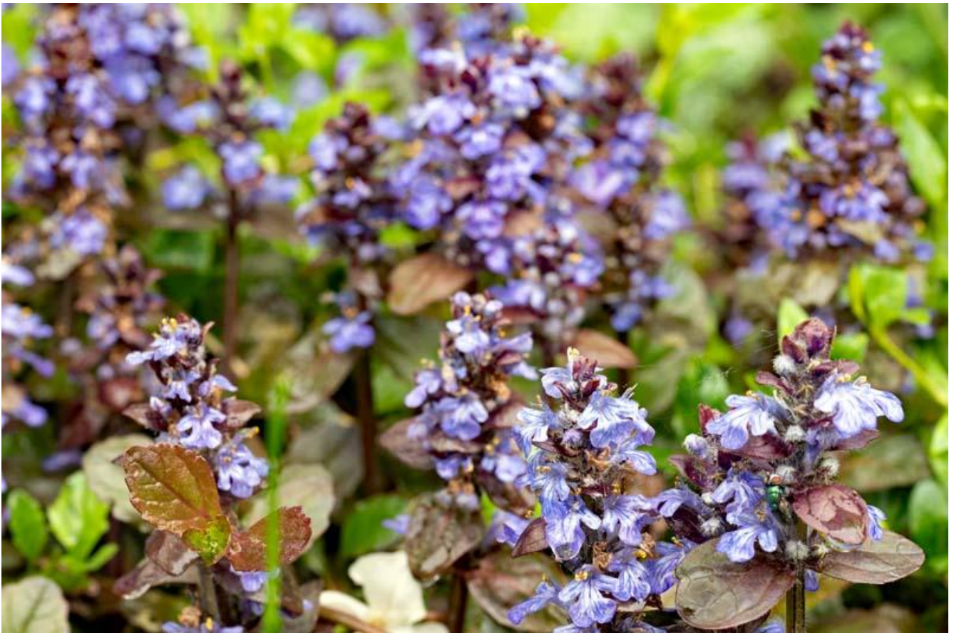
Ajuga met roodachtig blad, 'atropurpurea' Afbeelding