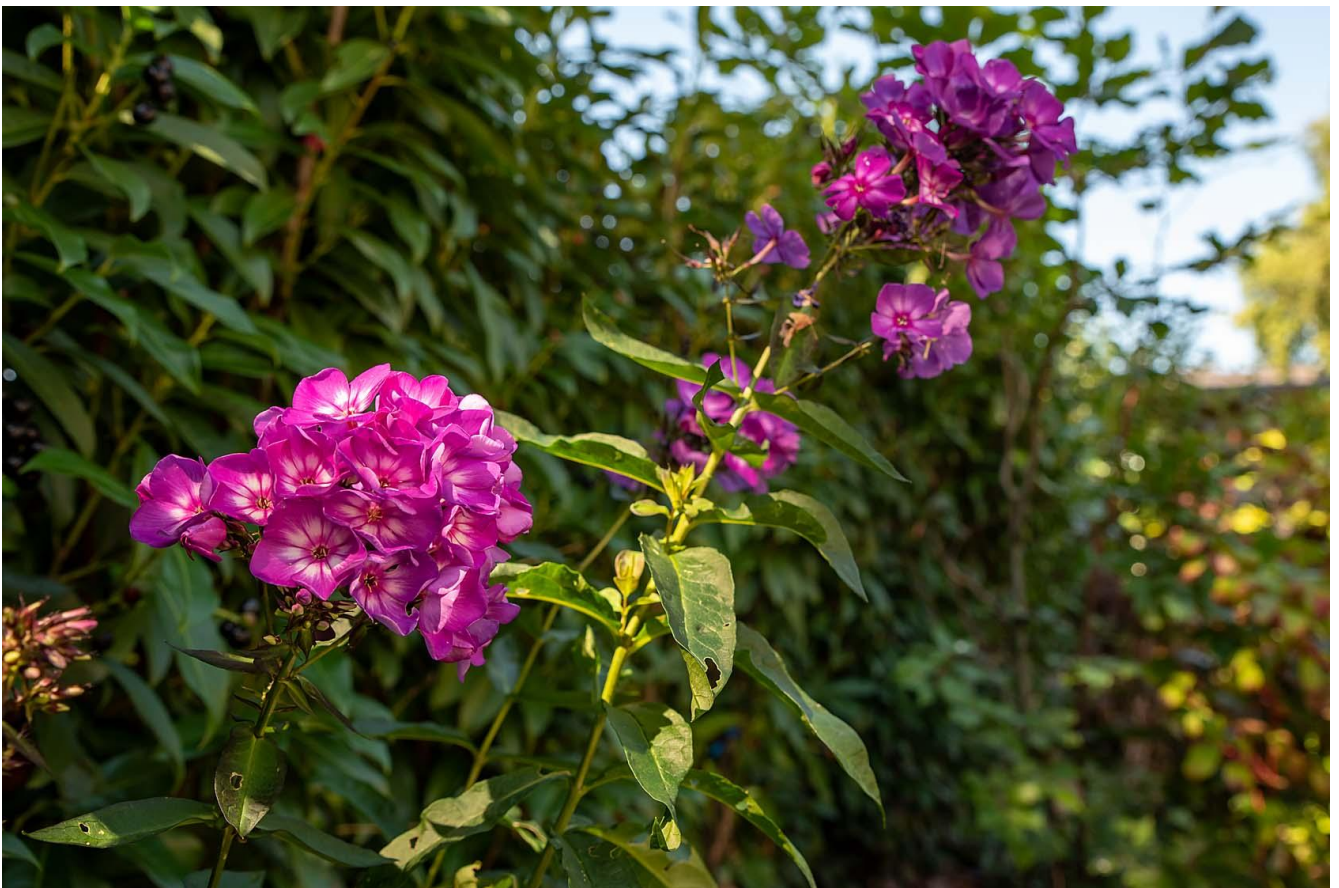
Phlox sweet summer surprise