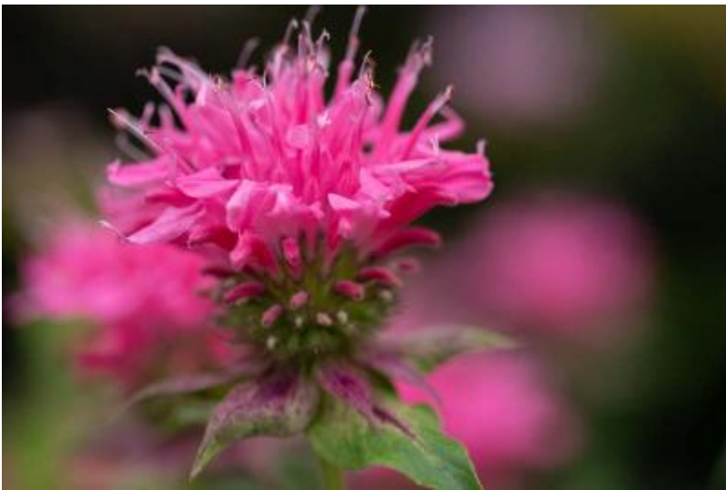
Monarda roze close-up