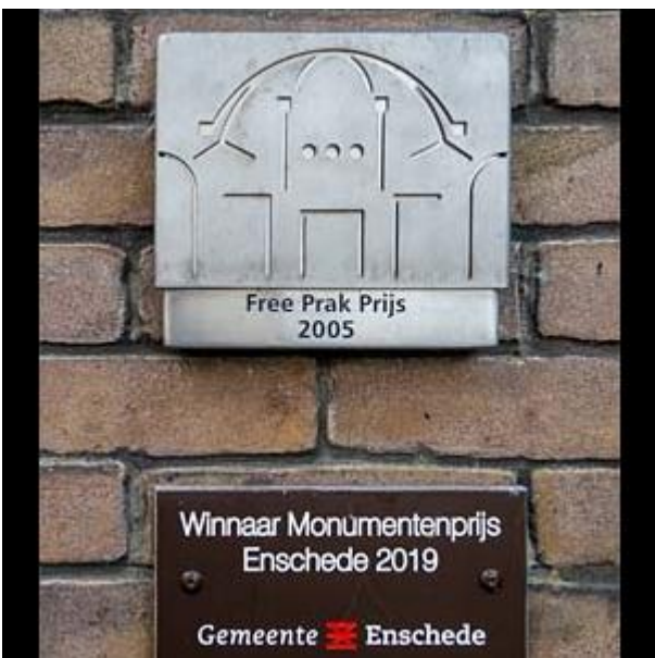
Synagoge bordje monument