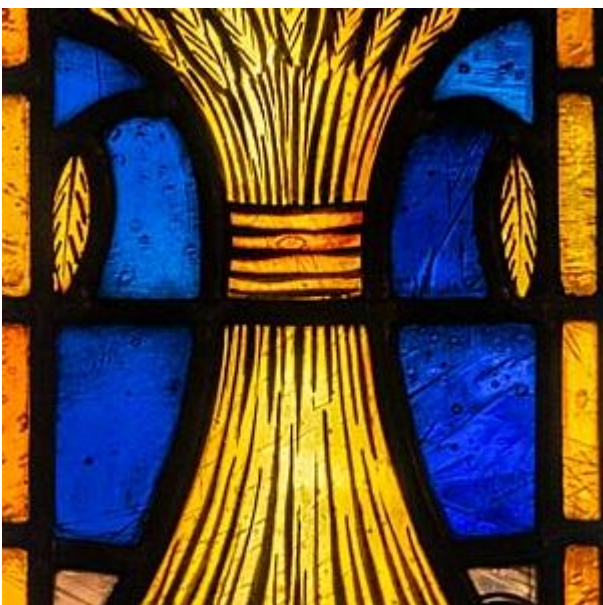
Synagoge glas-in-lood detail korenschoof