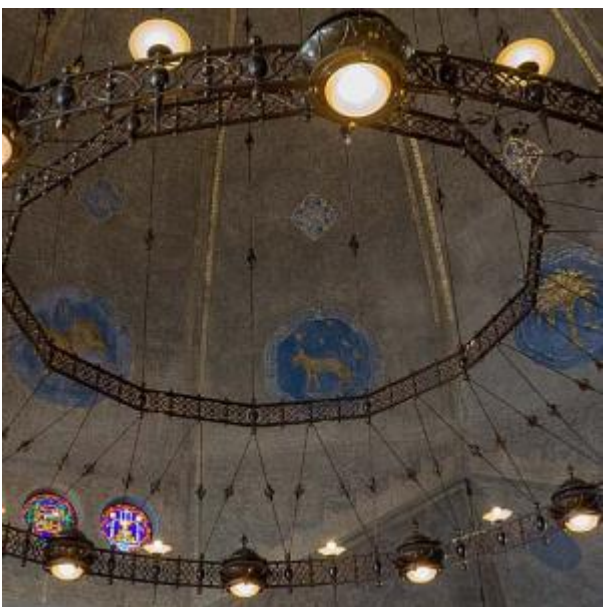
Synagoge plafond koepel met lampen