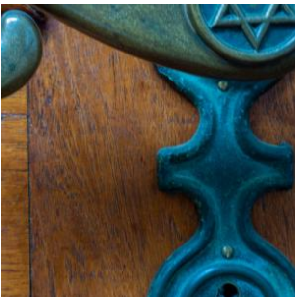
Synagoge detail deurkruk