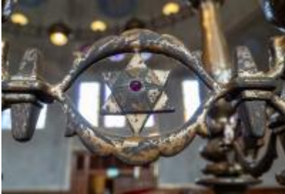
Synagoge detail davidster

Er is heel veel te zien en onze gids kan prachtig vertellen over de synagoge. Na de tour met de gids kun je nog rustig op ontdekkingsstocht. Als je eindelijk klaar bent, krijg je koffie met eigengemaakte appeltaart.