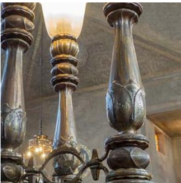
Synagoge detail lamp