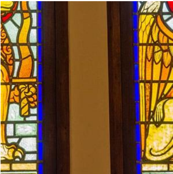
Synagoge glas-in-lood detail leeuw

DEZE STEEN GETUIGE OR ONS EN ONS NAGESLA DAT WY DE SYNAGOGE EN HARE BYGEBOUWEN BEN GESTICHT TER EERE GOD EN ZYN HEILIGE LEEF N DEN JARE 5639 A.M