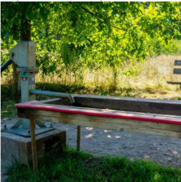
Pomp om mee te spelen