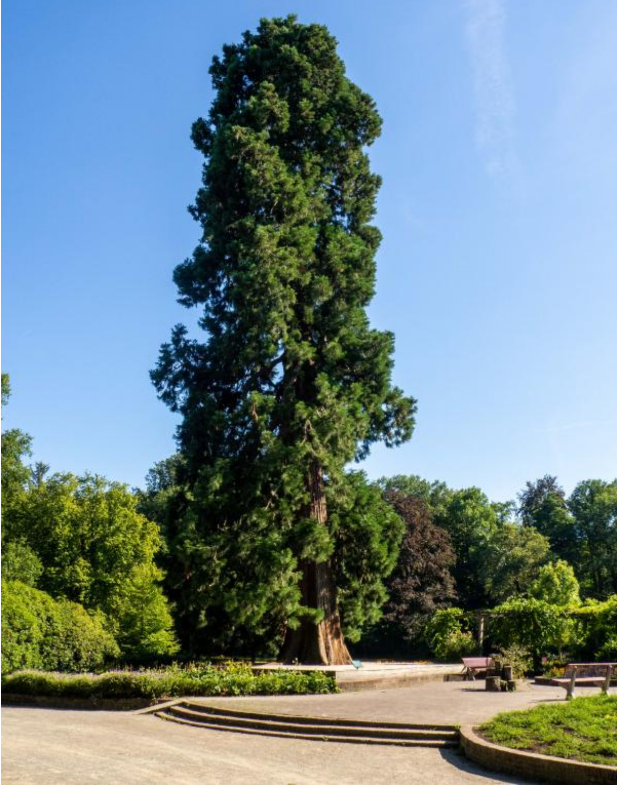
Sequoia in Ledeboerpark Afbeelding