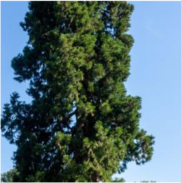
Sequoia in Ledeboerpark