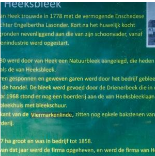
Van Heeksbleek uitleg