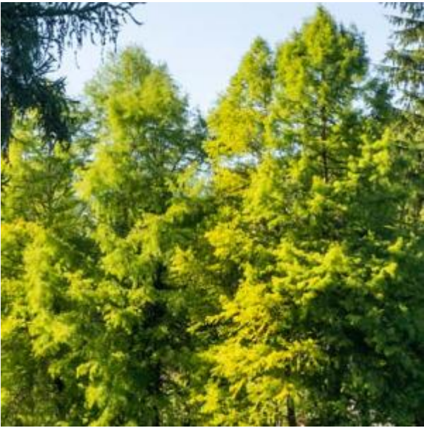
Vijver met bomen