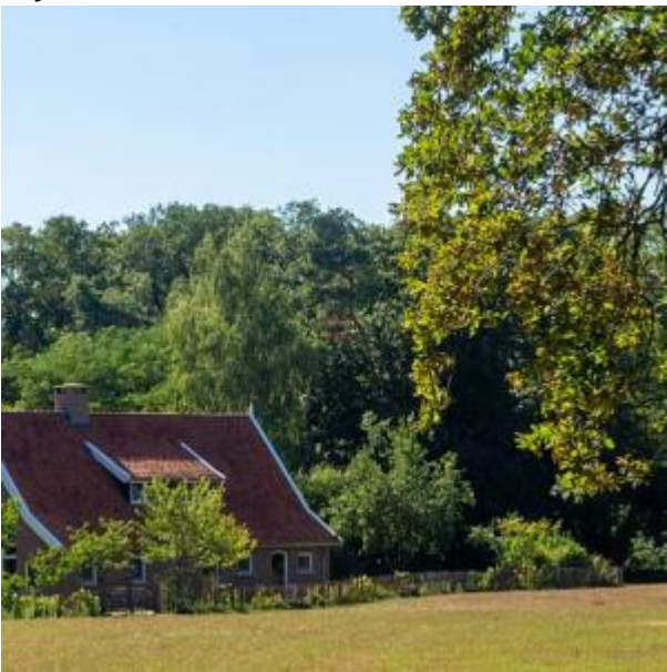
Boerderij in het park