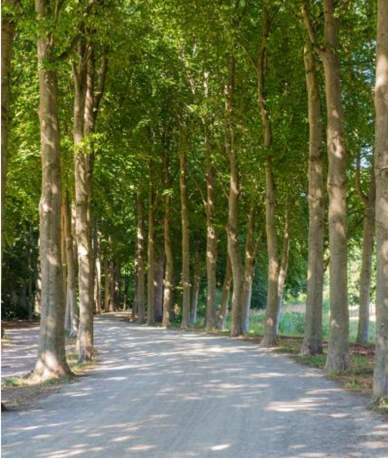
Laan in het park Afbeelding