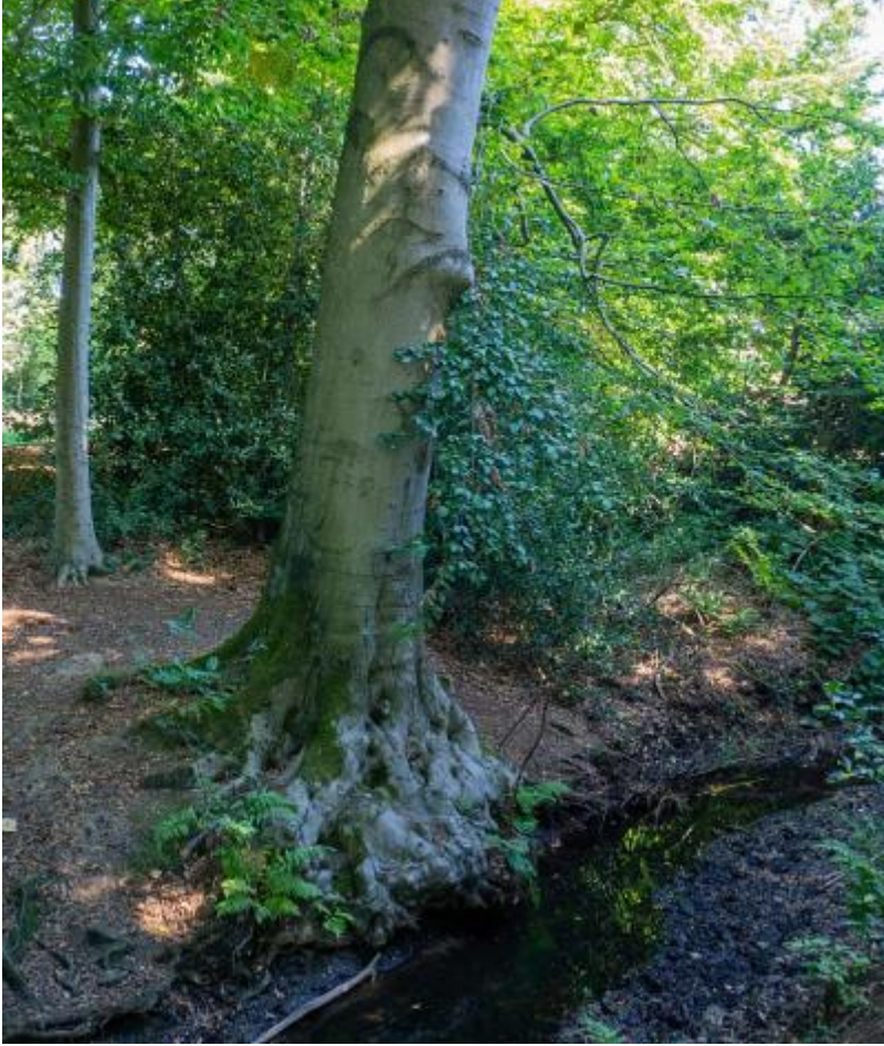
Beuk, wortels in de beek