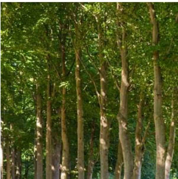
Laan in het park