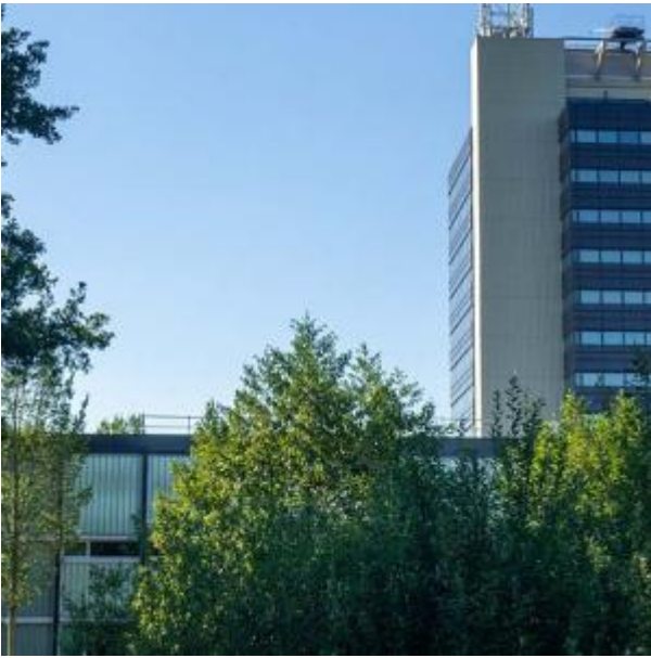
Universiteit naast het park