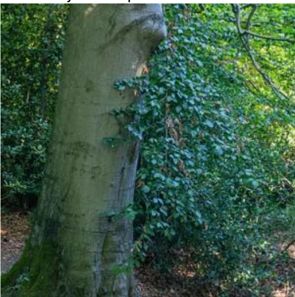
Beuk, wortels in de beek