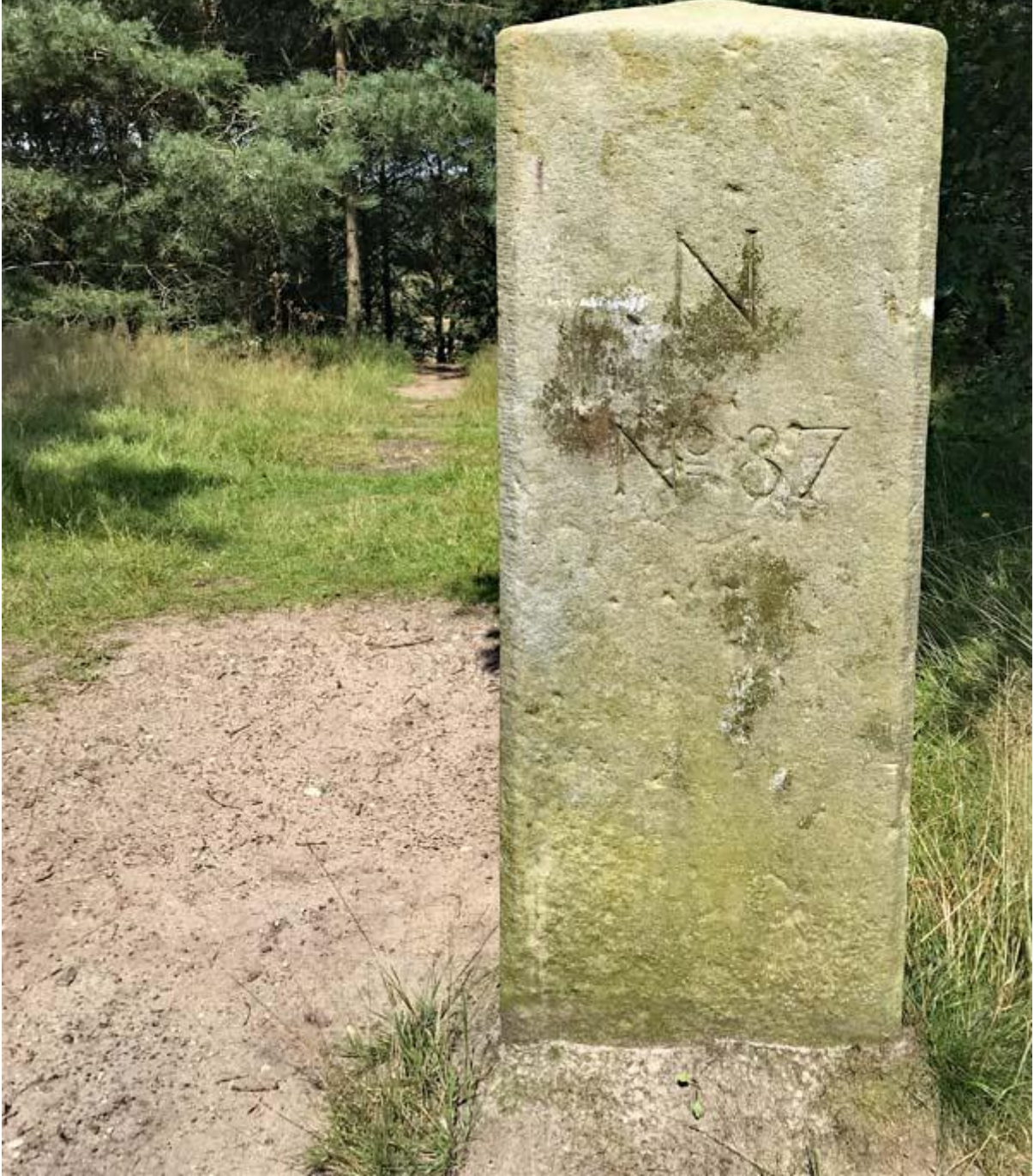
Over de poal