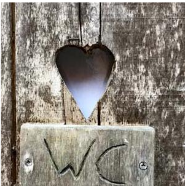
Molen van Frans WC-deur