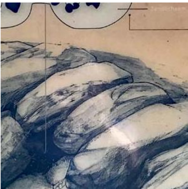
Over het hunebed