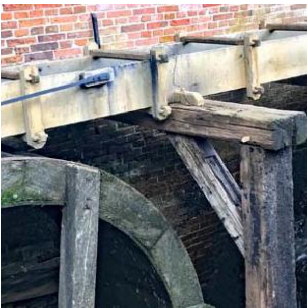
Molen van Frans buiten