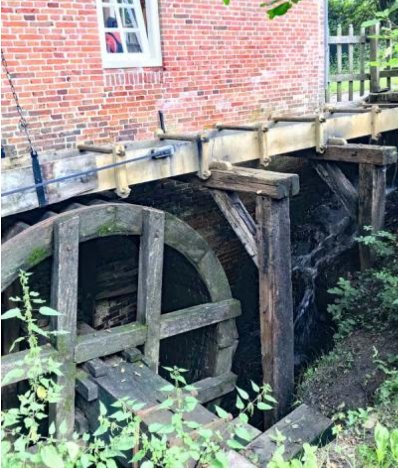
Molen van Frans buiten Afbeelding