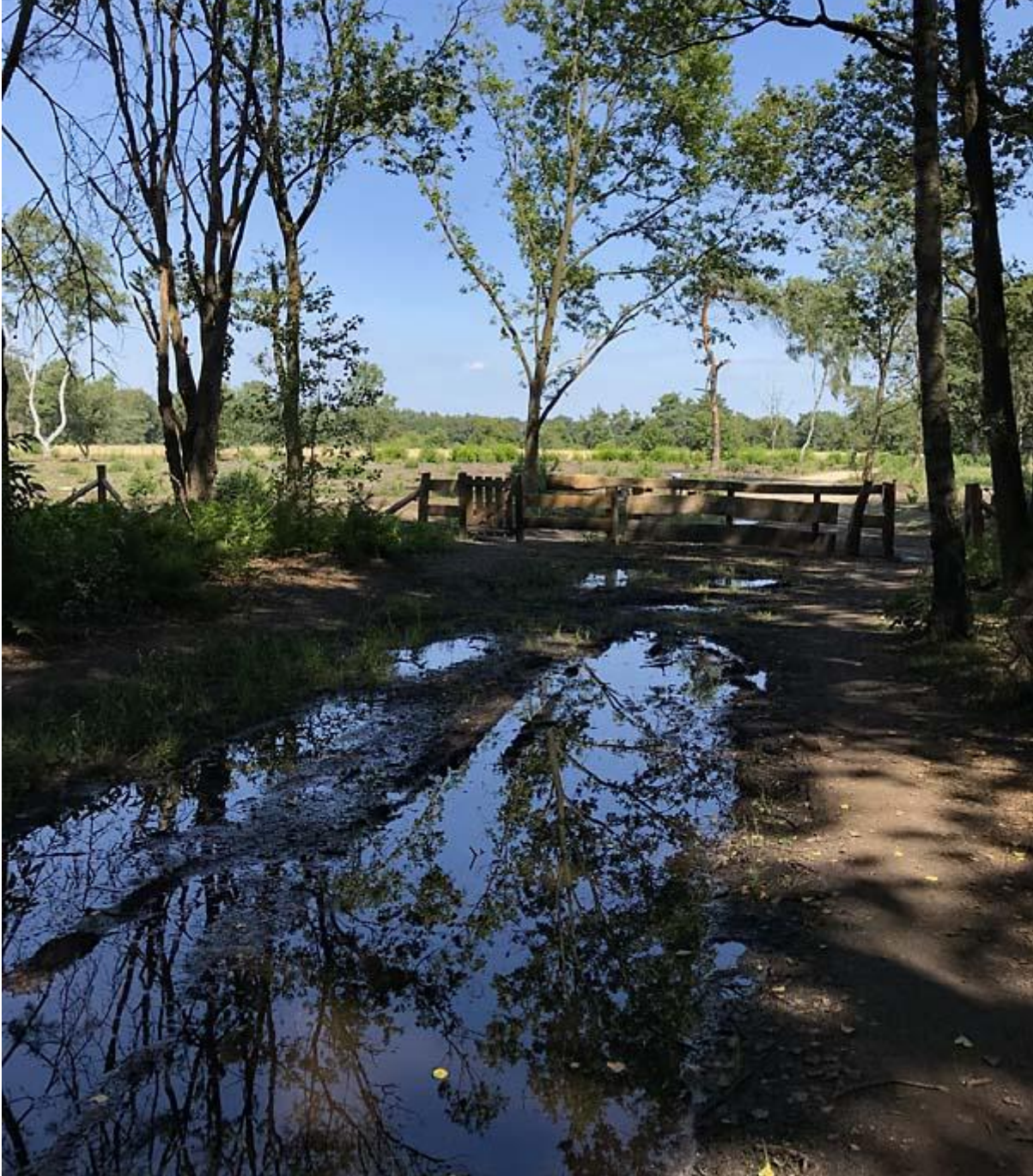
Cirkels van Mander, ingang