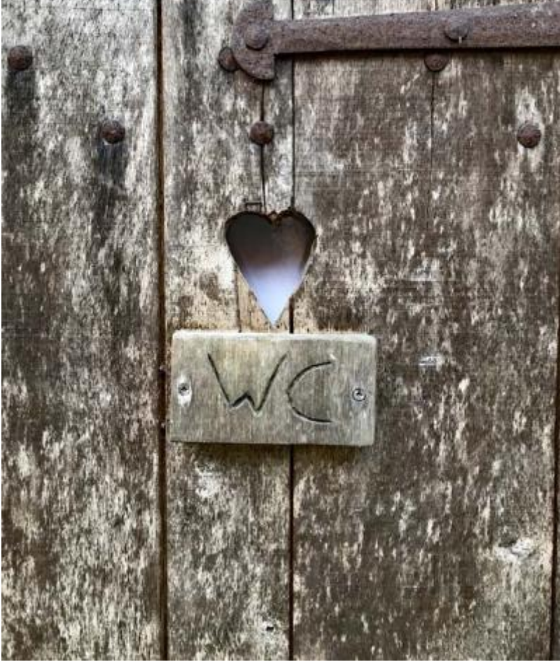
Molen van Frans WC-deur