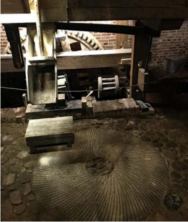
Molen van Frans binnen Afbeelding