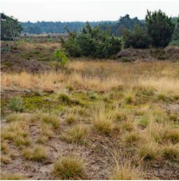
Borkeld hei met uitzicht