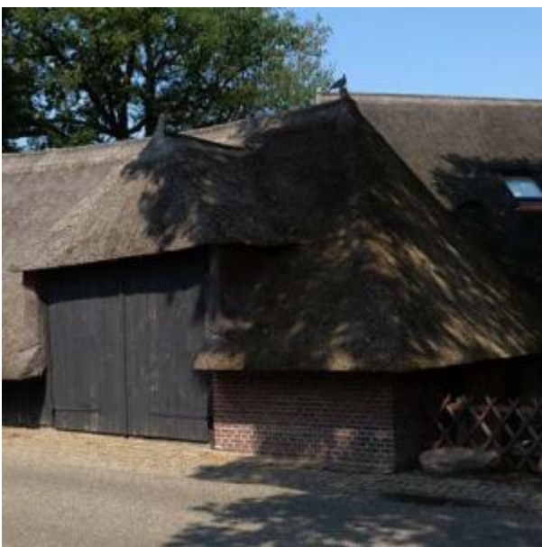
Borkeld, boerderij dwarsritschöppe