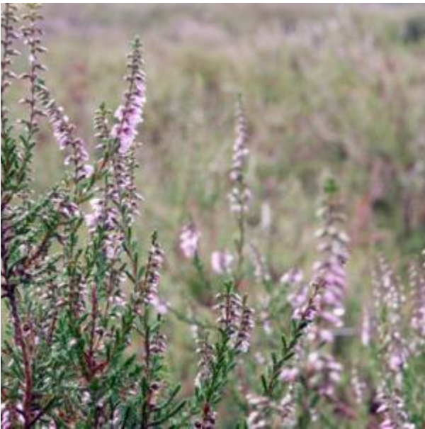
Borkeld, hei in bloei