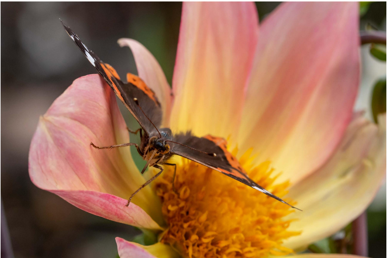
Vlinder op dahlia Informatie: Op VTwonon