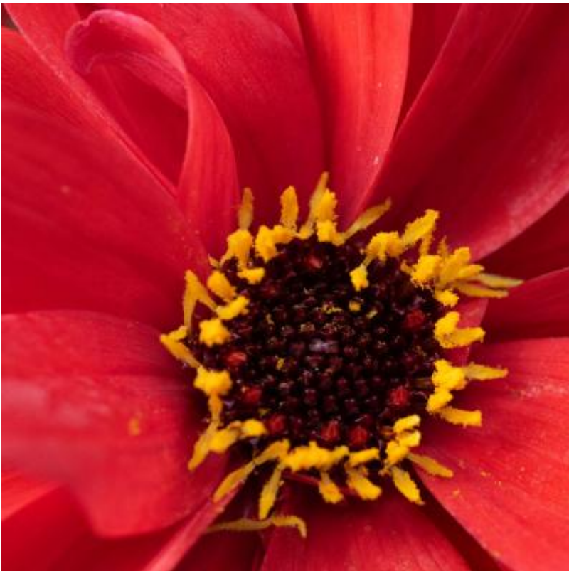
Dahlia detail Afbeelding