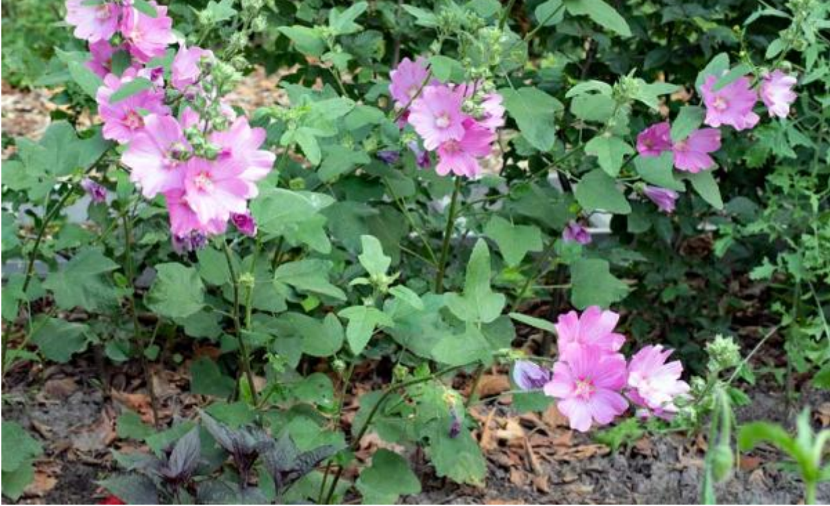
Lavatera 'blushing bride'