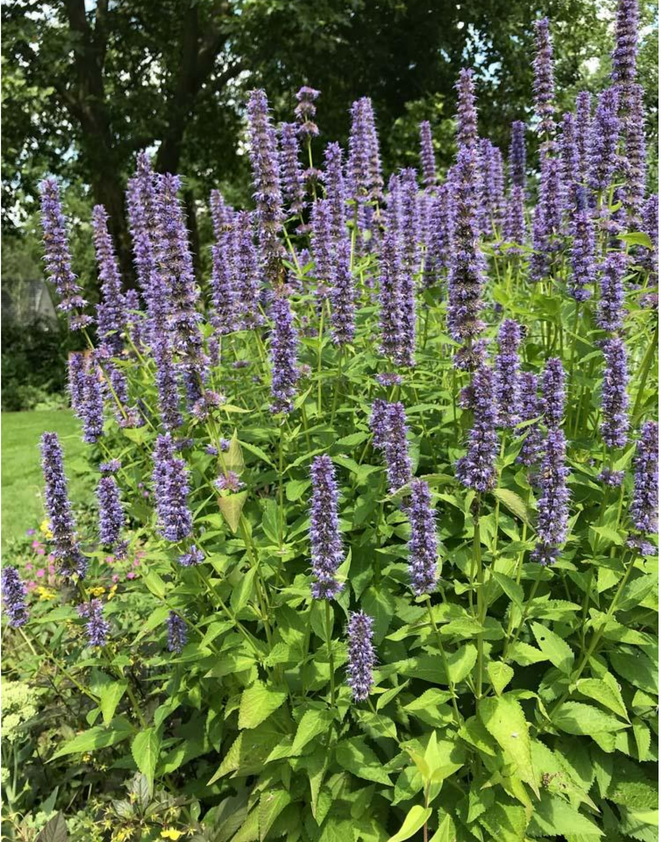
Agastache in de tuin