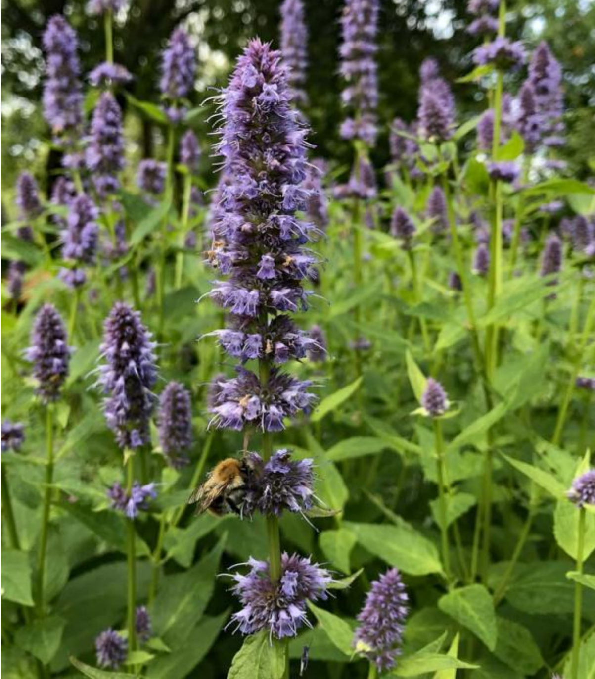
Agastache met bij