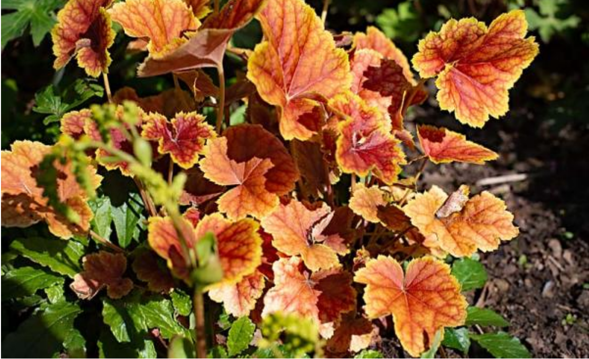
Heuchera licht Afbeelding