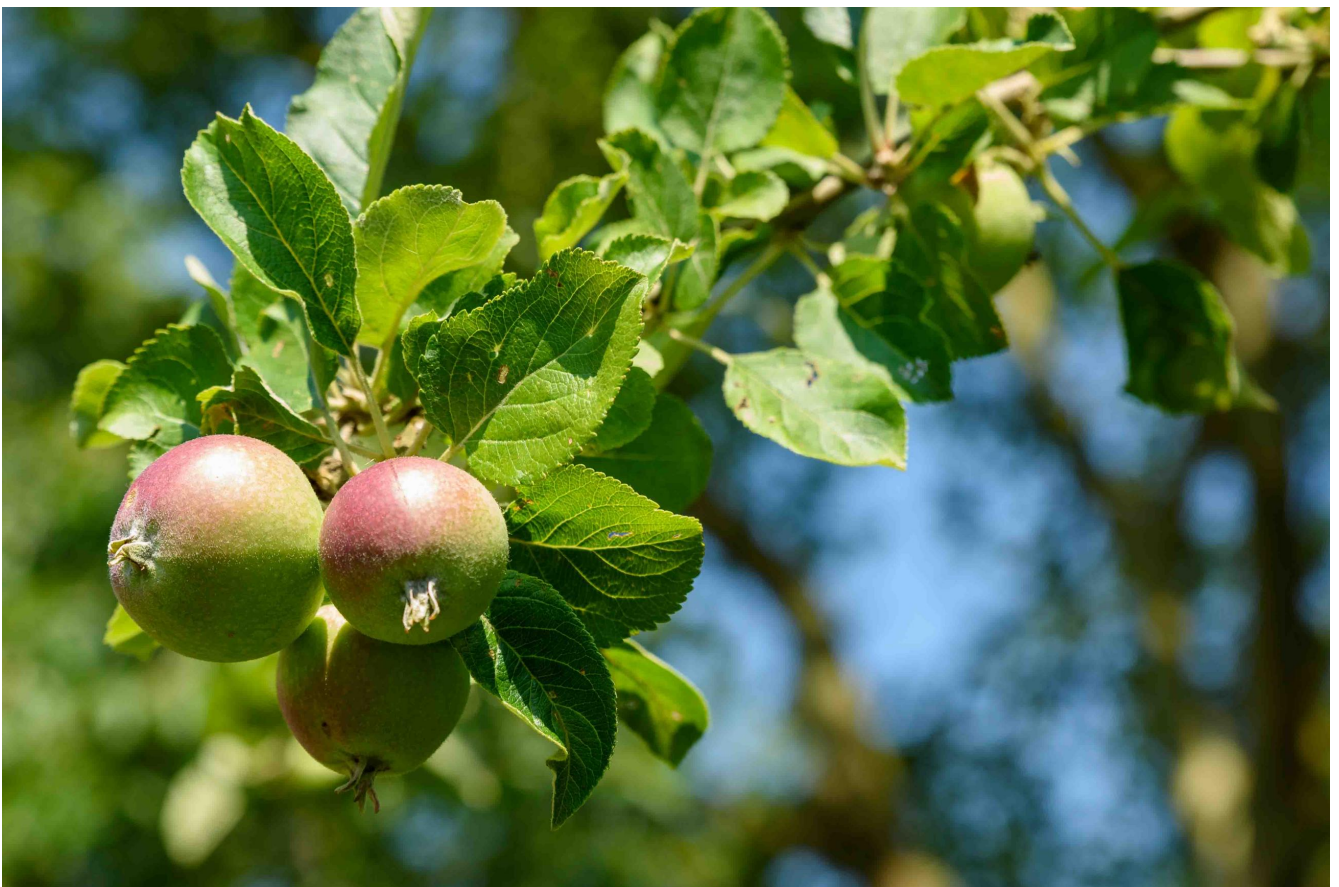
Alkmene met jonge appels