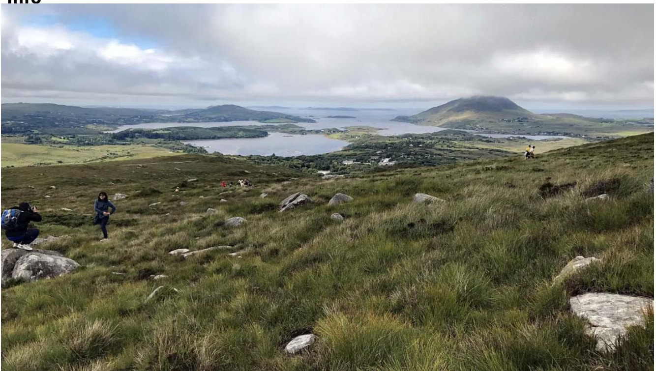
Diamond Hill afdaling uitzicht op zee Afbeelding