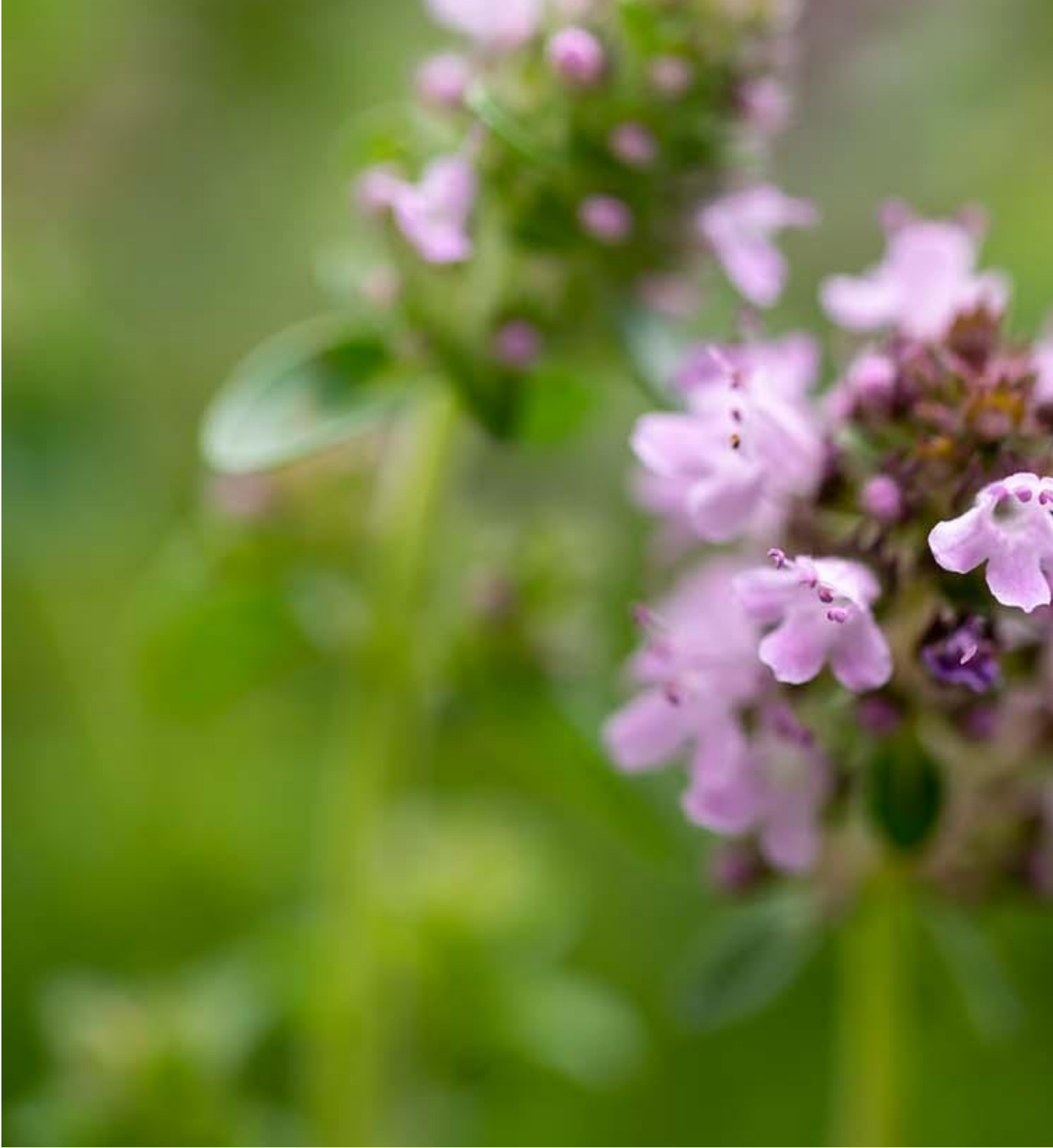
citroentijm Bloei: 05