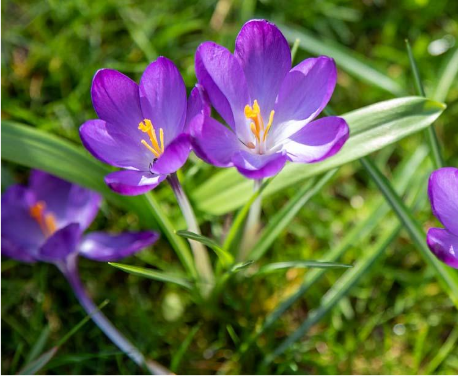
Boerenkrokus dichtbij Afbeelding