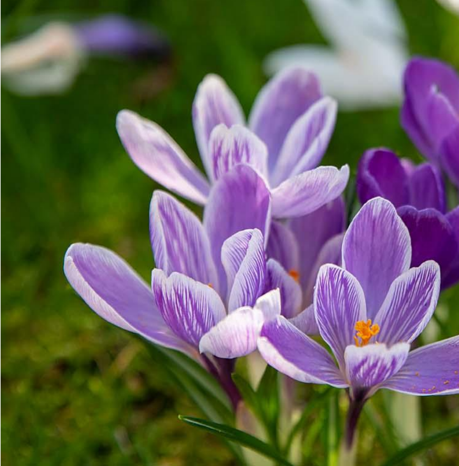
Krokus paars dichtbij Afbeelding