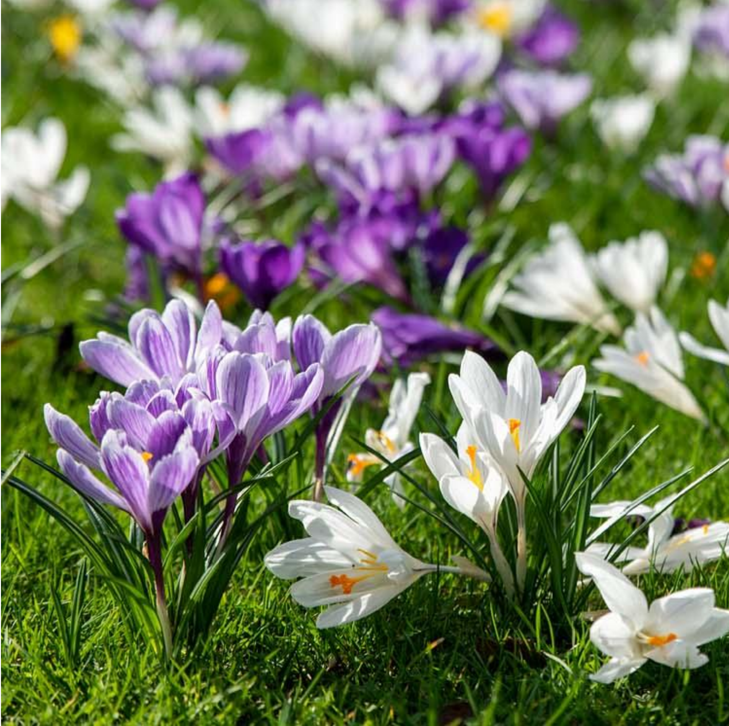
Veld met krokus Afbeelding