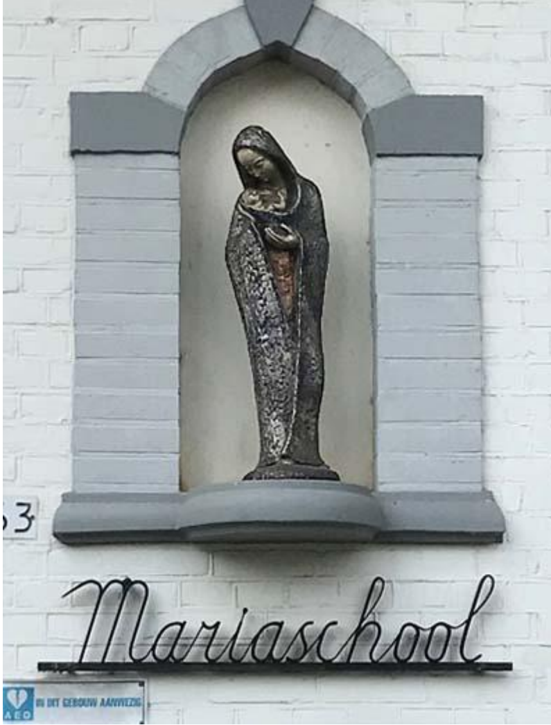
Beuningen, school. Vertrouw op... de AED