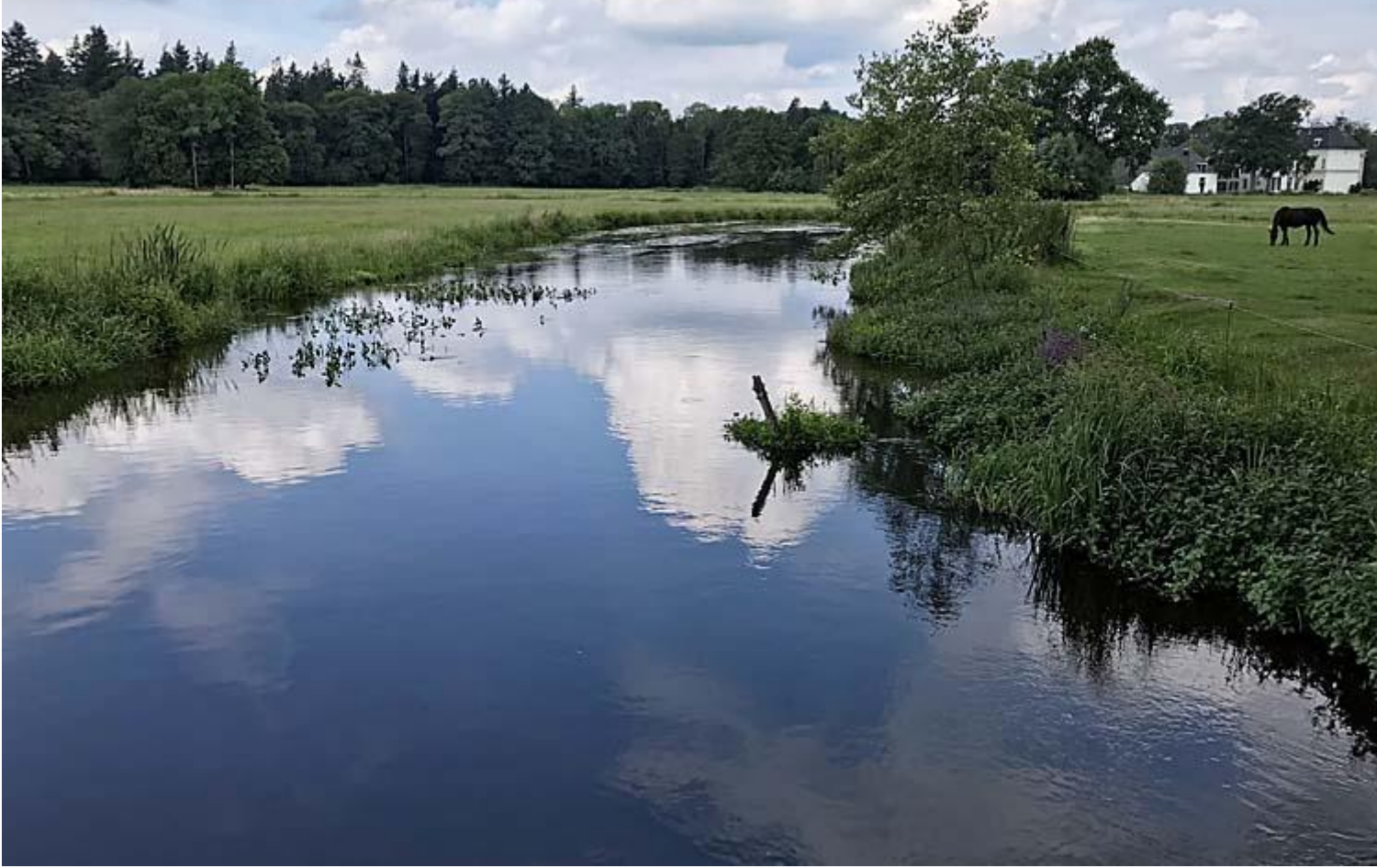
Dinkel door Singraven