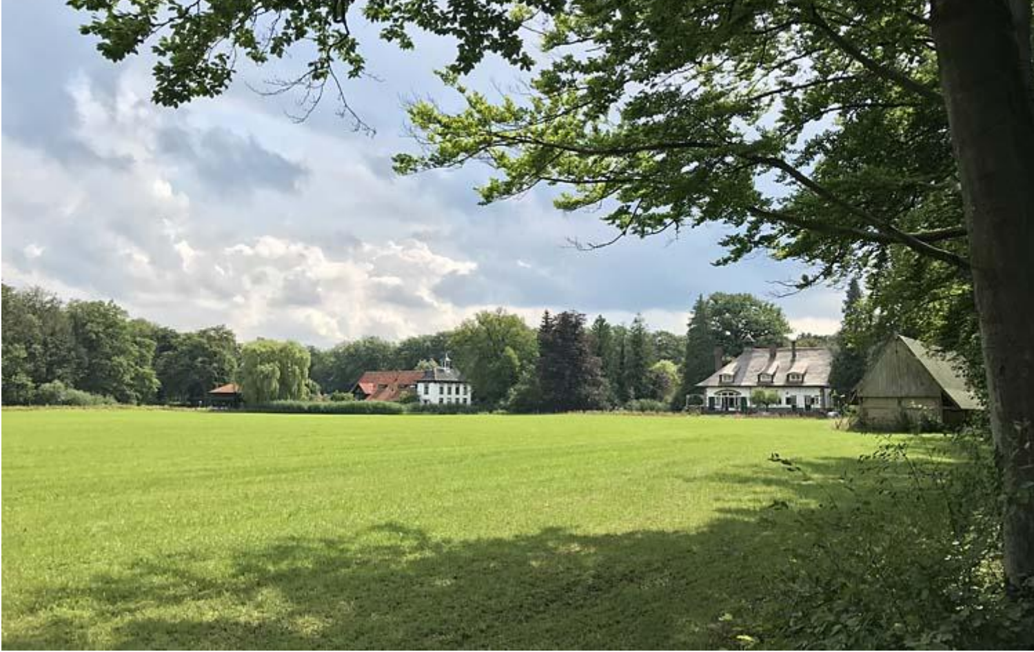
Singraven met huizen