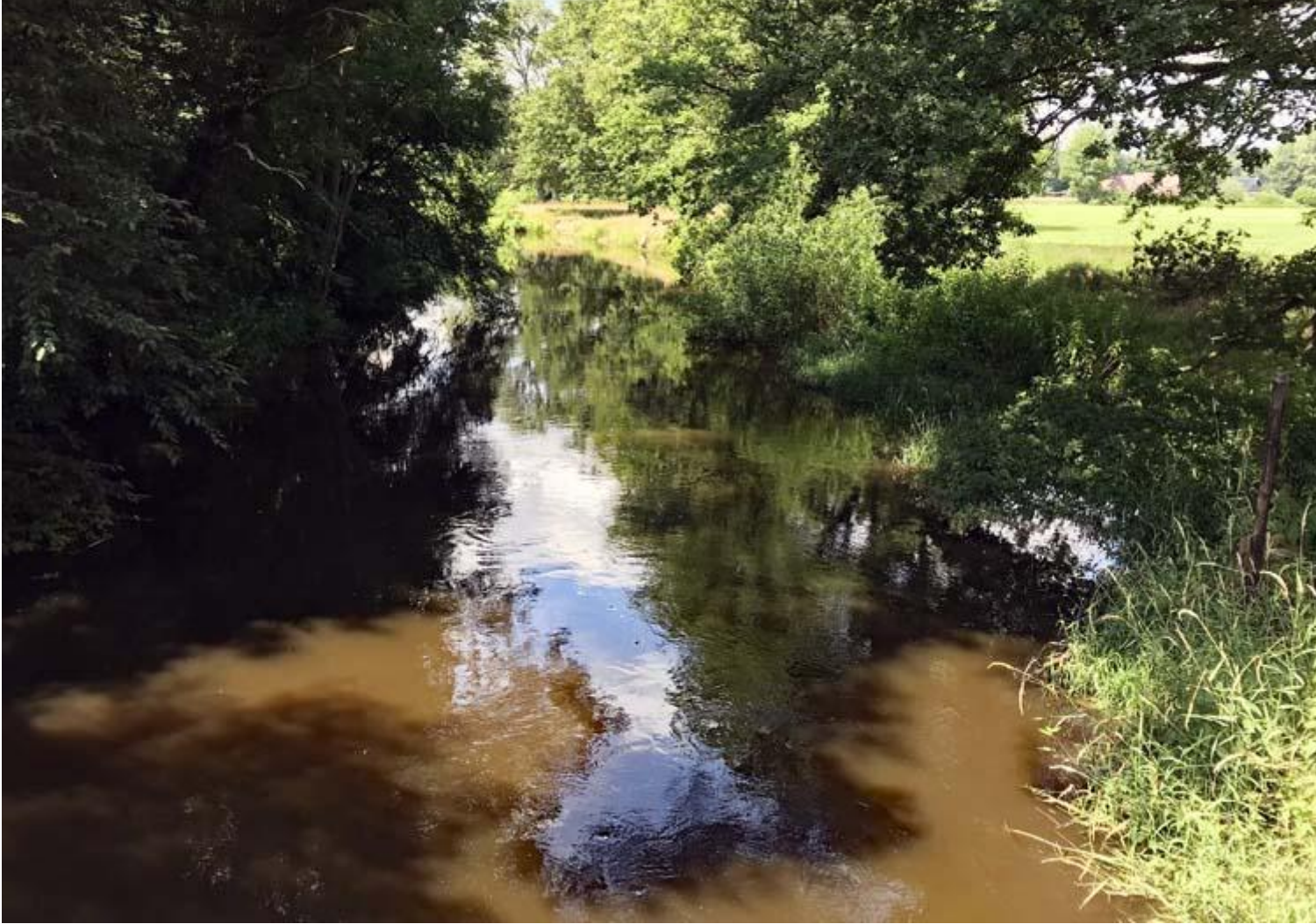
Dinkel bij Beuningen