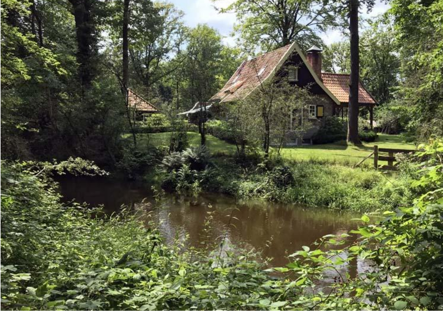
Dinkel, huis aan de oever