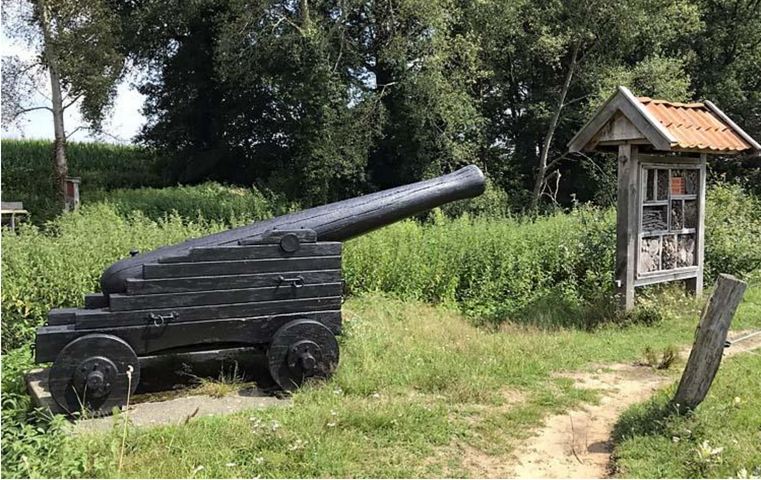
Mauritsbrug met kanon