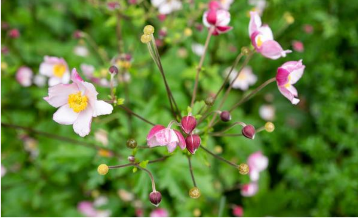
Herfstanemoon van boven Afbeelding