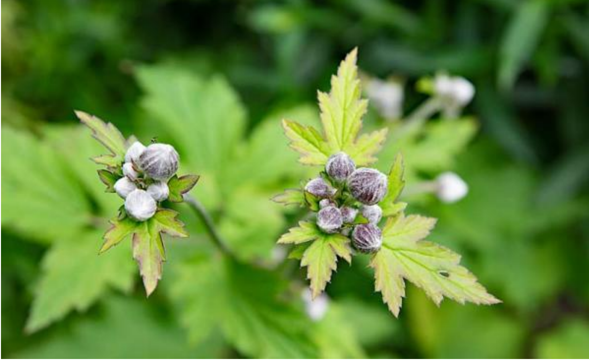
Herfstanemoon in de knop