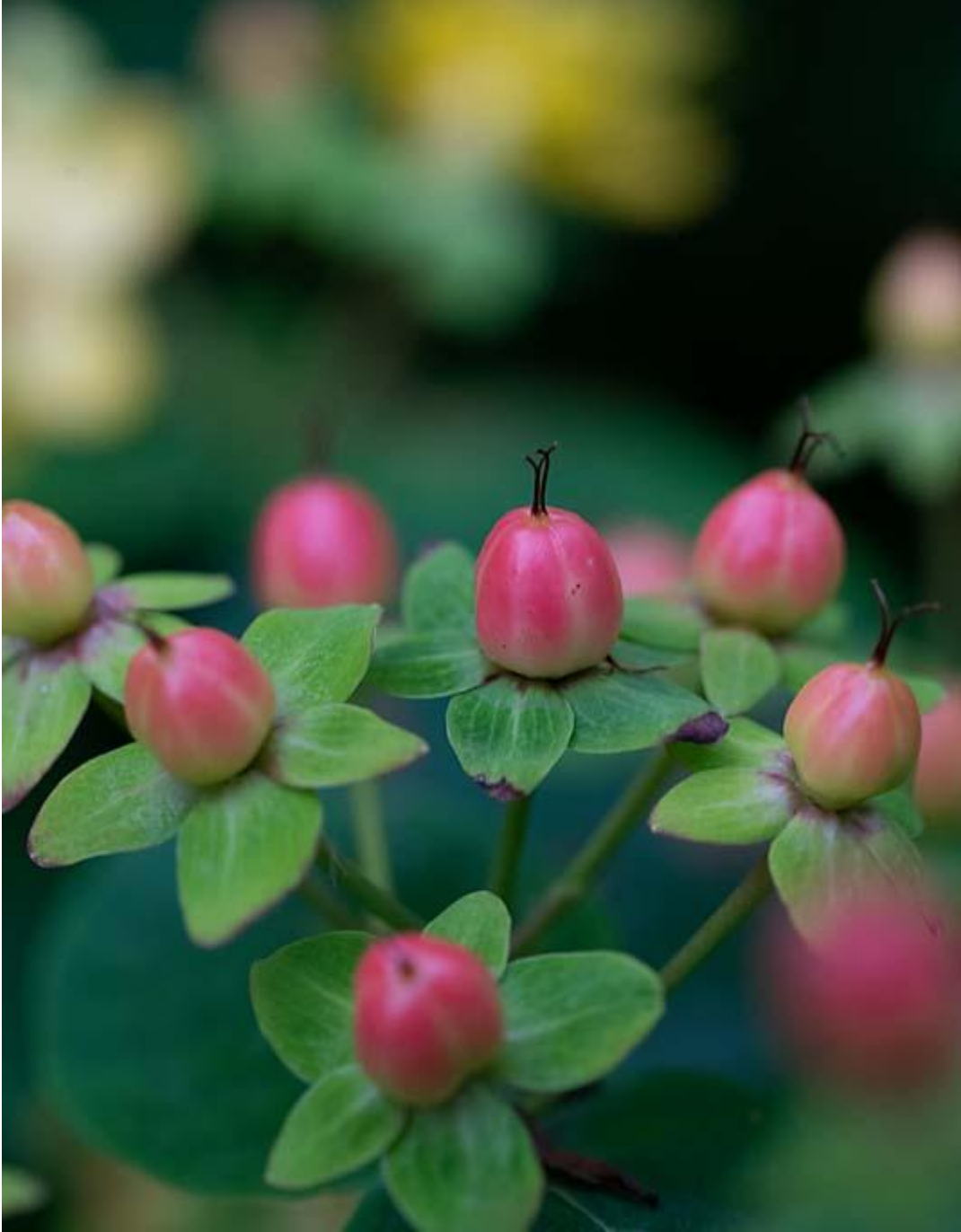
Hypericum bessen detail