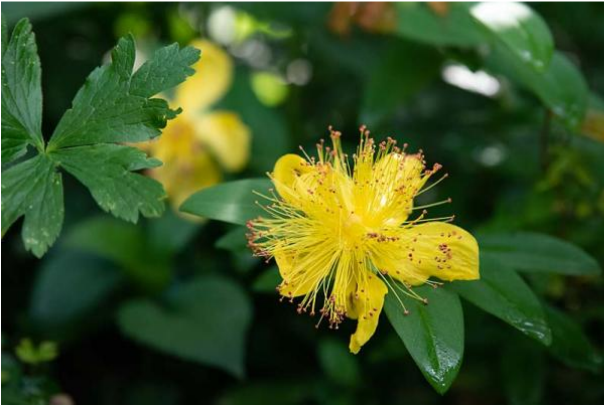
Hypericum bloem van boven