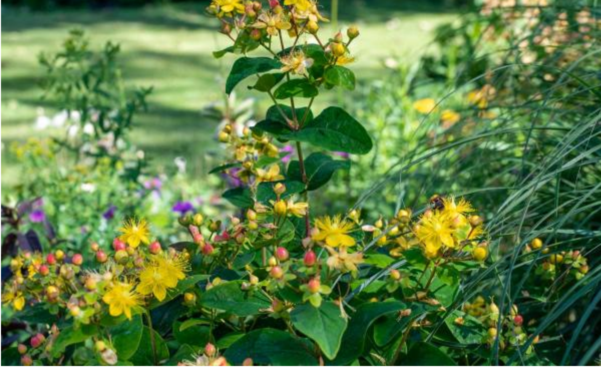
Hypericum bloei en bessen en bijen