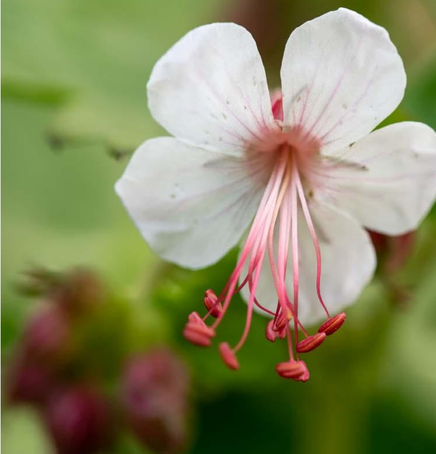
Geranium macrorrhizum Spessart detail Afbeelding