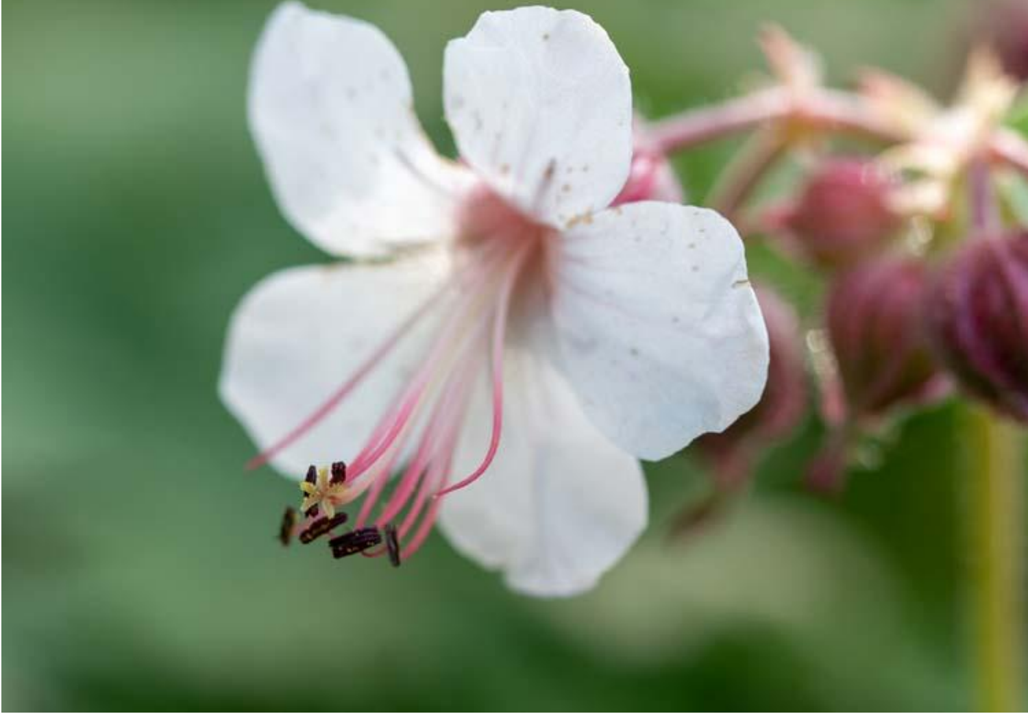
Geranium macrorrhizum Spessart stuifmeel Afbeelding