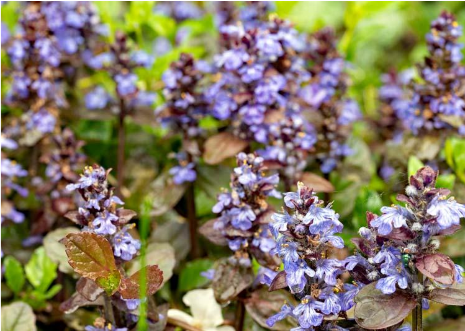
Ajuga met roodachtig blad, 'atropurpurea' Afbeelding