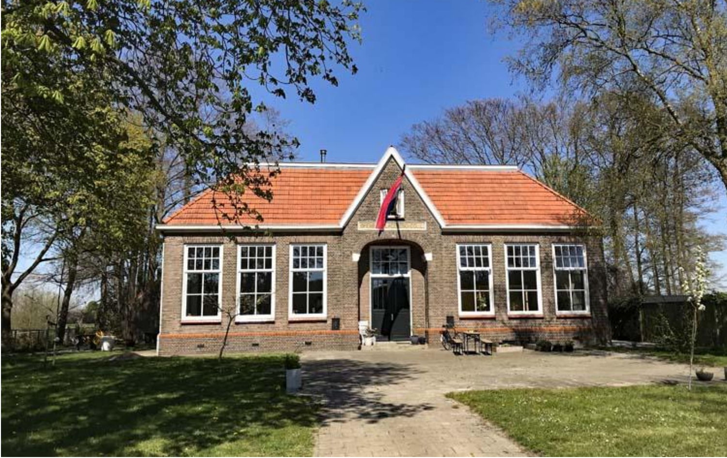
Twekkelo, voormalige school