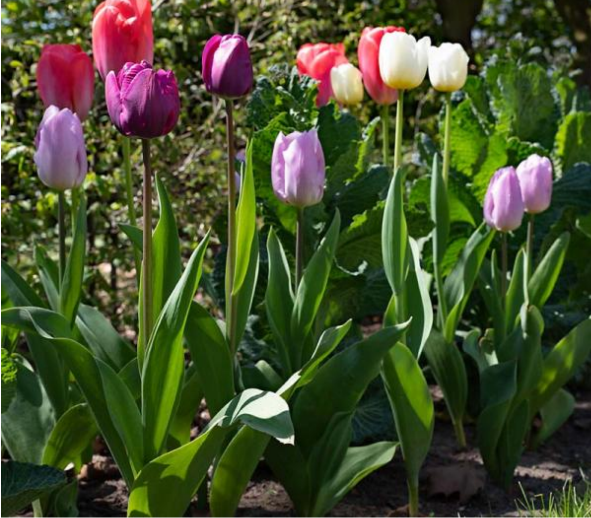
Tulpen in de tuin