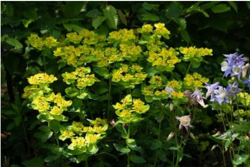
Euphorbia polychroma 1